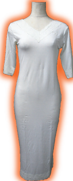
■ヒート+ふいっと ワンピースM / L 参考上代 各¥6,000