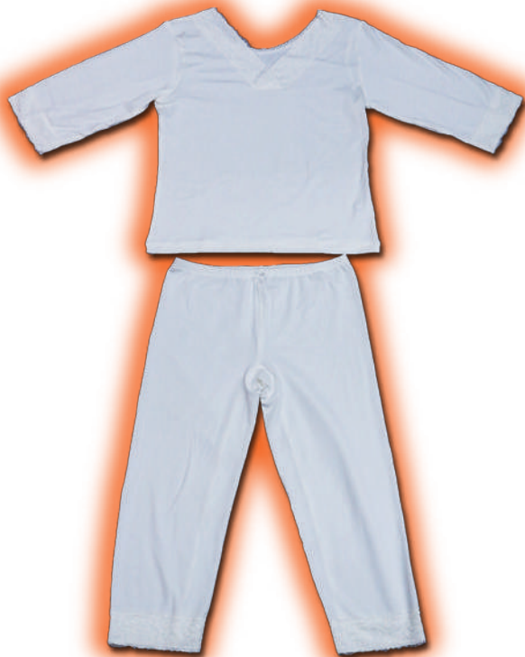
■ヒート+ふいっと シャツM / L パンツM / L 参考上代 シャツ¥3,500 パンツ¥3,000