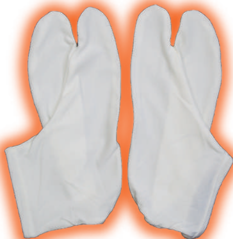
■ヒート+ふいっと 足袋インナー M(22.5~24.5cm) L(25.0~27.0cm) 参考上代 各¥650