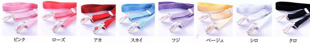
ピンク ローズ アカ スカイ フジ ベージュ シロ クロ