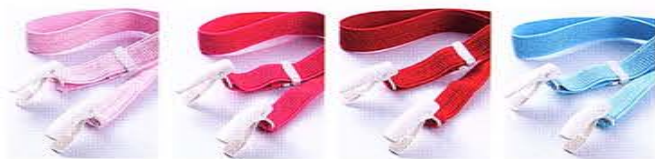
ピンク ローズ アカ スカイ