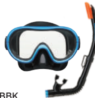
FBBK 【フィッシュテールブルーブラック】 4983608467627