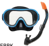
FBBK 【フィッシュテールブルーブラック】 4983608467597