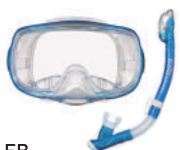
FB 【フィッシュテールブルー】 4983608147208