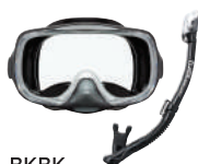
BKBK 【ブラックブラック】 4983608458724