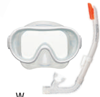
W 【ホワイト】 4983608467658