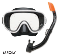
WBK 【ホワイトブラック】 4983608467610