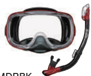
MDRBK 【メタリックダークレッドブラック】 4983608147192