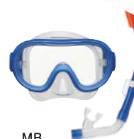
MB 【マンタブルー】 4983608467641