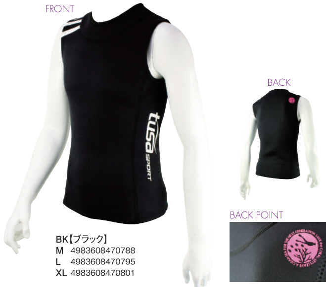
BK【ブラック】 M 4983608470788 L 4983608470795 XL 4983608470801