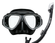
BKBK 【ブラックブラック】 4983608460468

MC_7500 (別売) ¥9,000 (本体価格)(片眼) 左右兼用レンズ 1.0~8/0.0.5度刻み テンバード加工