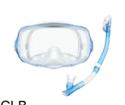
CLB 【クリアライトブルー】 4983608458700 限定