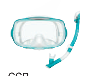
CGR 【クリアグリーン】 4983608458717 限定

ツイン スタイリッシュな軽量2眼タイプ。確実なフィットング、目とレンズの距離感にこだわった広視界マスク