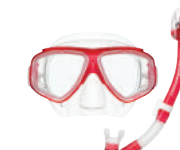
HR 【ハイビスカスレッド】 4983608460482