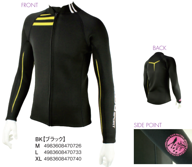
BK【ブラック】 M 4983608470726 L 4983608470733 XL 4983608470740