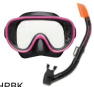
HPBK 【ホットピンクブラック】 4983608467603