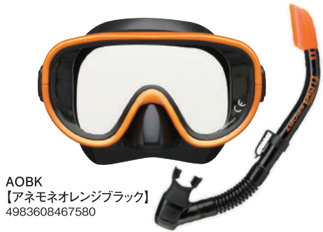
AOBK 【アネモネオレンジブラック】 4983608467580