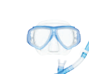
CLB 【クリアライトブルー】 4983608460475 限定