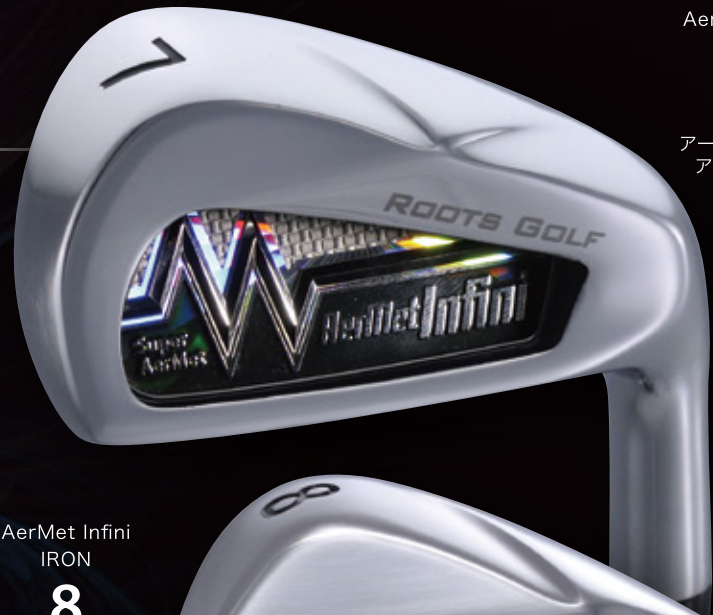
AerMet Infini IRON 7 アーメット Infini アイアン 7番