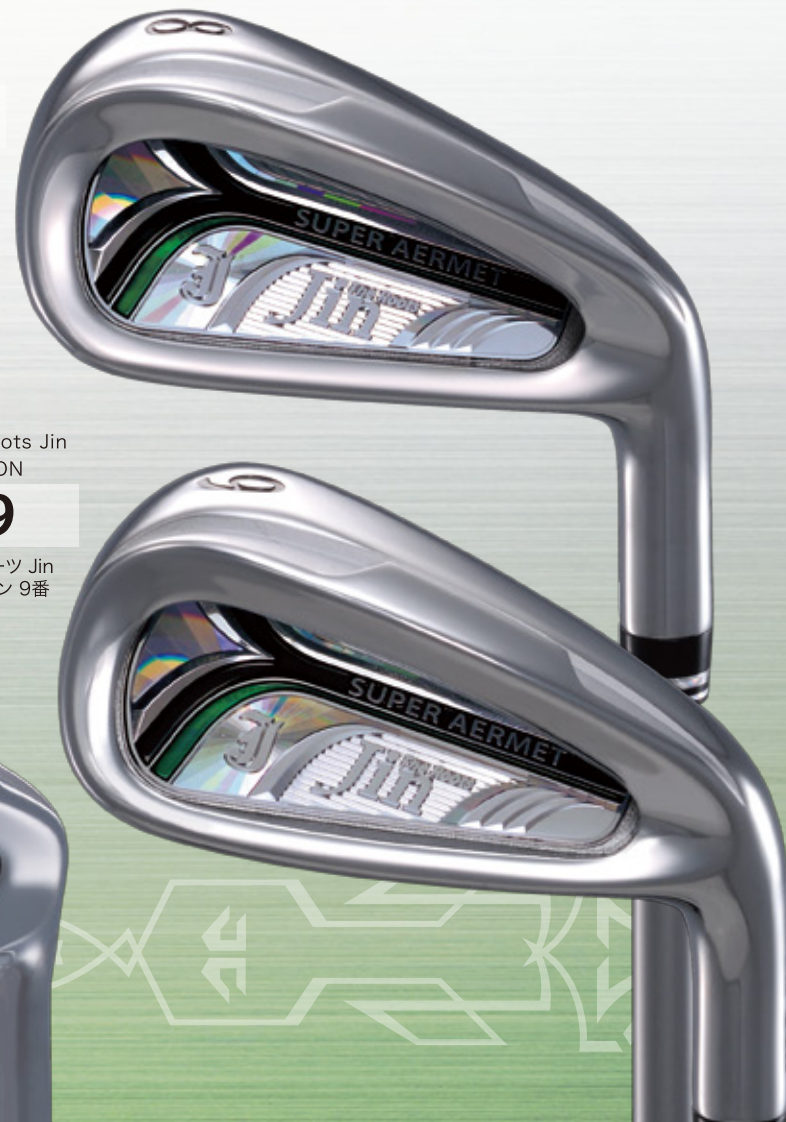
The Roots Jin IRON