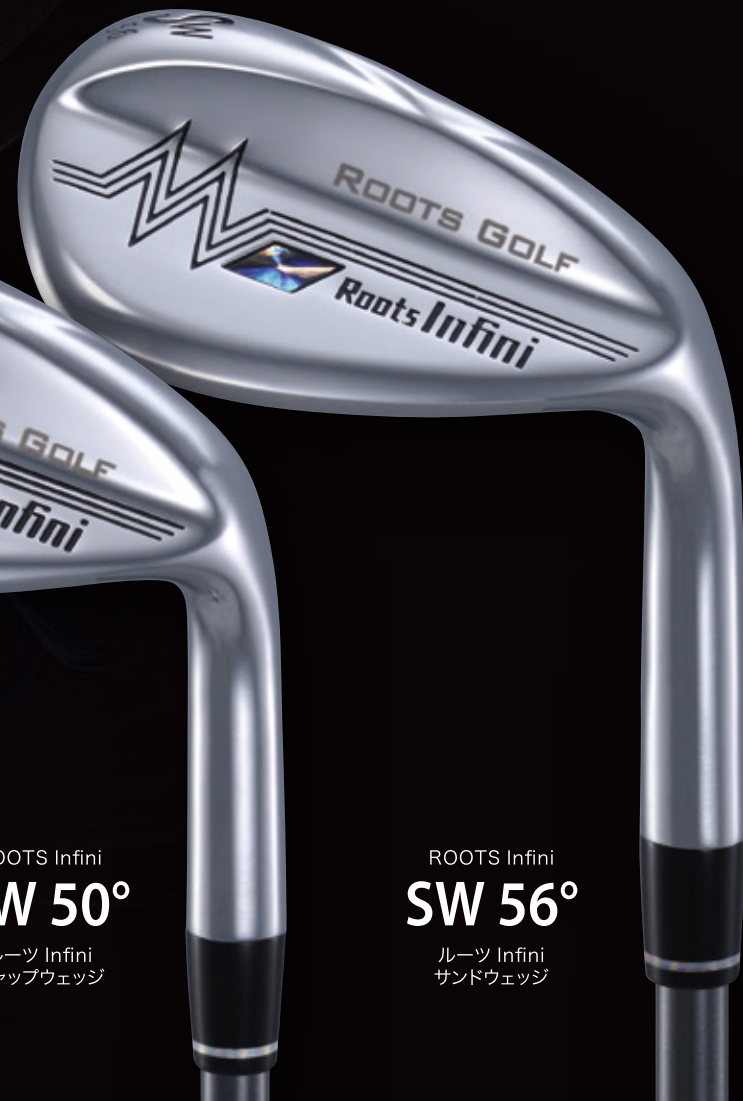
ROOTS Infini SW 56° ルーツ Infini サンドウェッジ