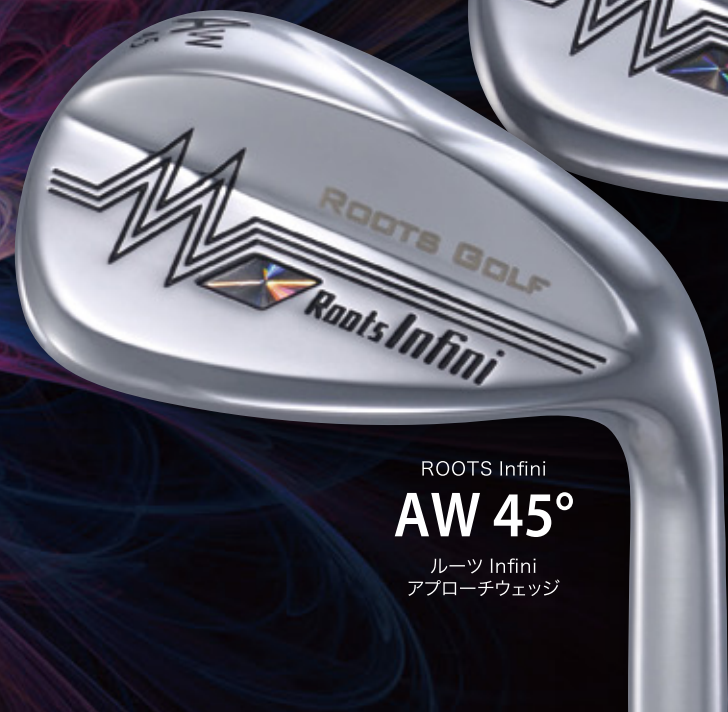
ROOTS Infini AW 45° ルーツ Infini アプローチウェッジ