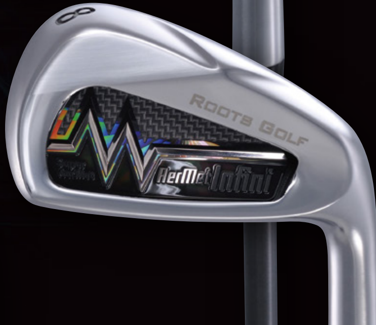
AerMet Infini IRON 8 アーメット Infini アイアン 8番