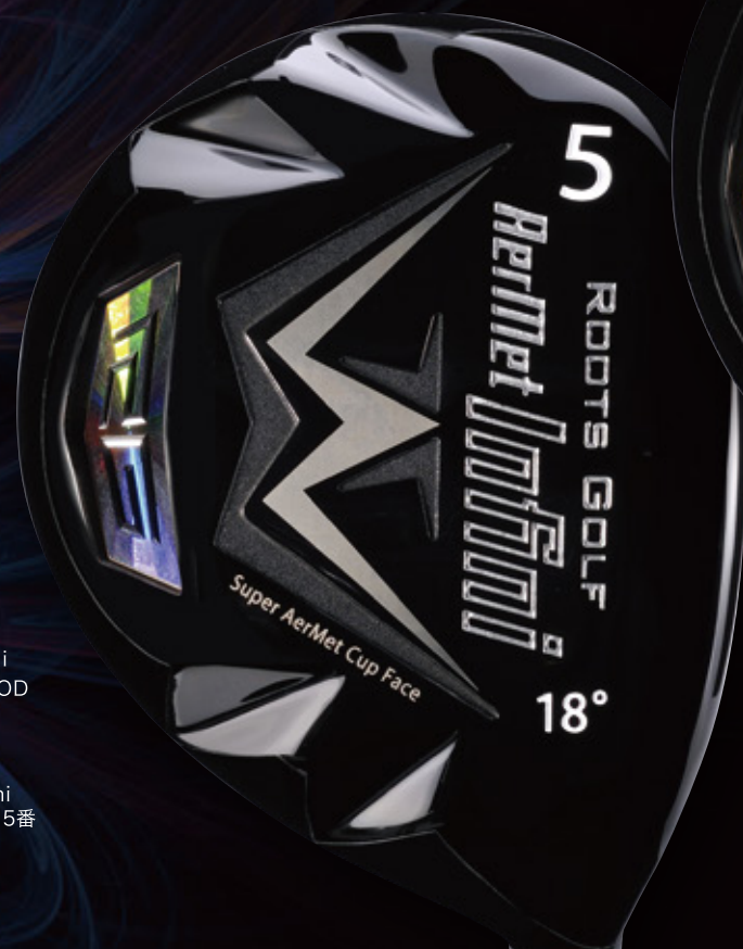
AerMet Infini FAIRWAY WOOD 5W アーメット Infini フェアウェイウッド 5番