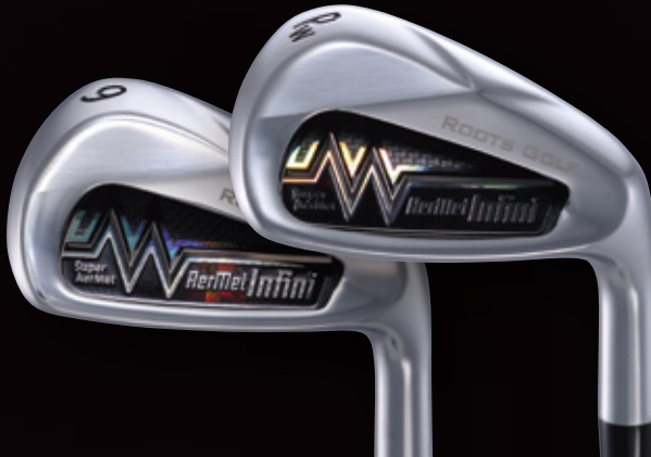
AerMet Infini IRON 9 アーメット Infini アイアン 9番