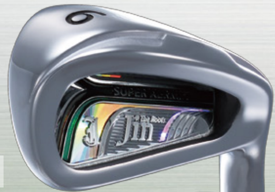
The Roots Jin IRON