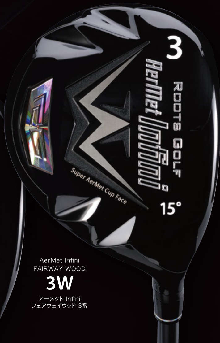
AerMet Infini FAIRWAY WOOD 3W アーメット Infini フェアウェイウッド 3番