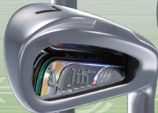
The Roots Jin IRON