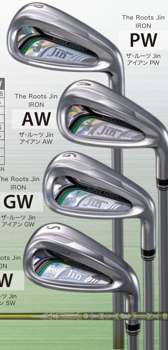
The Roots Jin IRON