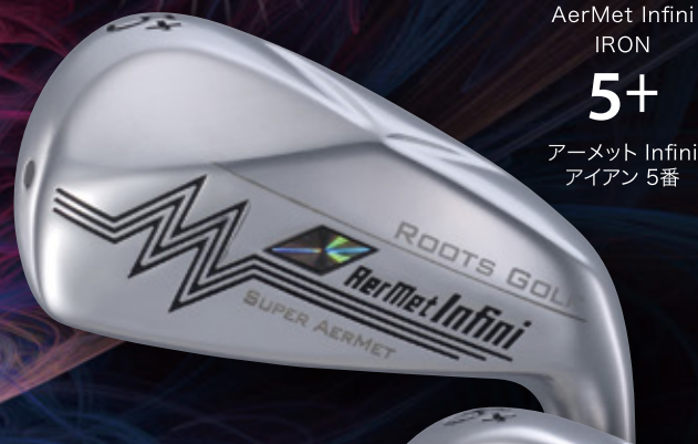
AerMet Infini IRON 5+ アーメット Infini アイアン 5番