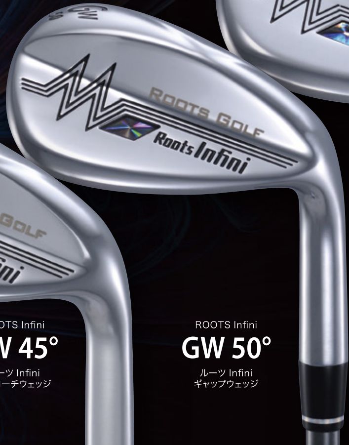
ROOTS Infini GW 50° ルーツ Infini ギャップウェッジ