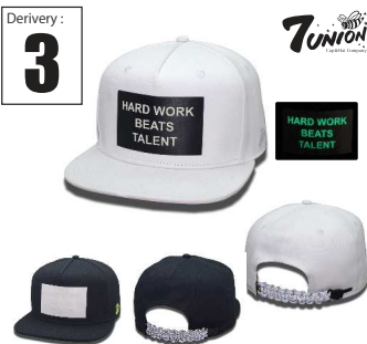
ICVW-109 H.B.T Derivery: APR Price: ¥ 5800(w/t) Material: 100% Cotton Color: White/ Black

ポテにコットンツイルを採用したフロントに今期のテーマであるHARD WORK BEATS TALENT (努力は才能を打ち負かす)のワードのみを光でプリントしたアイテムです。クラブ毎編題でワードだけが光るんです。バックにはリアフレクターの紐を編んでベルトを作りました何れも何れもONLY 7UNIONです。