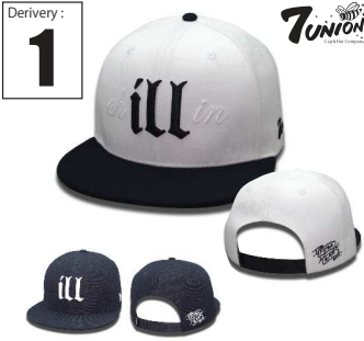
ICVW-103 Chilln Derivery: FEB Price: ¥ 5800(w/t) Material: 20%Wool 80% Acrylic Color: White x Black/Black

2015Fで大好評だったILLシリーズ、今期スナップバックになってカムバック！もはや説明不要なILLデザイン、カラーもBLK,BLK×WHTの2色展開でコーディネートもしやすいヘビロテ間違いのないアイテムです。