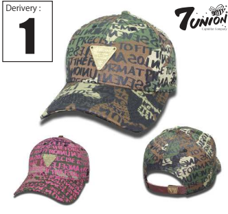
ICVW-102 Wood Monogram Derivery: FEB Price: ¥ 5500(w/t) Material: 100% Cotton Color: Woodland Black / Woodland Pink

ウッドランドカモの上に7UNIONのスローガンであるPrecise to fit the formatを手書きしてプリント、フロントに3rd eye プレートをONしたBENT BRIM CAPです。