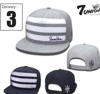
ICVW-114 Reflectors line Derivery: APR Price: ¥ 5800(w/t) Material: 20%Wool 80% Acrylic Color: H Gray/ Black

フロントに日本人であれば誰でも分かるあの名作のロゴをサンプリング、色も合わせやすいカラーに絞りました。今まではなかなか馴染めなかったカタカナですが今期多くのインポートブランドがこって日本語ものグラフィックをドロップ。