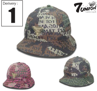
ICVW-501 Wood Monogram Bell Derivery: FEB Price: ¥ 6000(w/t) Material: 100% Cotton Color: Woodland Black / Woodland Pink

ウッドランドカモの上に7UNIONのスローガンであるPrecise to fit the formatを手書きしてプリント、フロントに3rd eye プレートをONしたBENT BRIM CAPです。