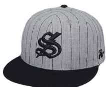
H Gray/Black Stitch