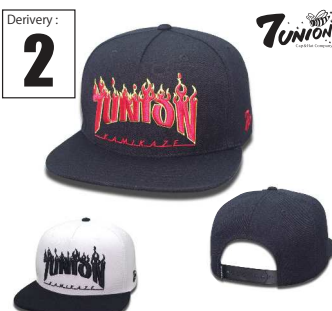
ICVW-108 Junion Burn Derivery: MAR Price: ¥ 5800(w/t) Material: 20%Wool 80% Acrylic Color: Black / White x Black

毎回好評を頂いているTEAMシリーズ、今期も面白いチームを加えました。2発目はBALTIMORE FUCKERSです。クラシックな雰囲気のストライプがデザインと90sにはやっていたケミカルワッシュとあえて表裏の違う生地を選択しました。よりスポーツツライクにストライプ90s風にケミカルとコーディネートに合わせるのも良いのでは。