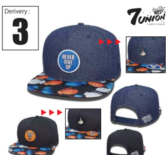
ICVW-115 Never Give Up Derivery: APR Price: ¥ 5800(w/t) Material: 100% Cotton / 100% Polyester Color: Denim/ Black

S/パネルのキャップフロント部分に3Mリアフレクターテープをシンプルに縫い付けたアイテムです。カラーも定番ブラック x グレー/リフレクター、グレー x ホワイト/リアフレクターと各コーディネートにはばっちりラインナップです。