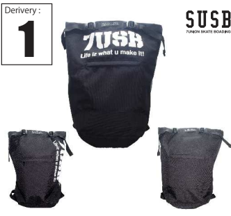
7ICVW-111B 7USB BACK PACK Derivery: FEB Price: ¥ 12500(w/t) Material: 100% Nylon Color: Black Front PT / Black Side PT / Black Back PT

ウッドランドカモの上に7UNIONのスローガンであるPrecise to fit the formatを手書きしてプリント、フロントに3rd eye プレートをONした6パネルバケットハットです。