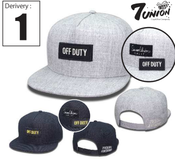
ICVW-104 Off duty Derivery: FEB Price: ¥ 5500(w/t) Material: 20%Wool 80% Acrylic Color: Black / H Gray

2015Fで大好評だったILLシリーズ、今期スナップバックになってカムバック！もはや説明不要なILLデザイン、カラーもBLK,BLK×WHTの2色展開でコーディネートもしやすいヘビロテ間違いのないアイテムです。