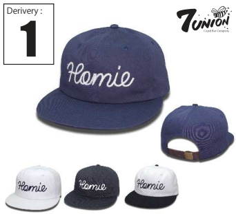
ICVW-120 Homie Derivery: FEB Price: ¥ 5500(w/t) Material: 100% Cotton Color: Navy/ White/ Black/ White x Black

2015より突如登場したツバの曲がったベントアダムキャップUSでもオシャレなアーティスティックな名前も。2016年はフロントにベントがより格好プリントされたついでにみなタイプが各社からドロップされる見込みです。まずはこのタイプはフロントにバラとスケルをミックスしたグラフィックを刺繍で表現したROCKやPUNKをイメージしたモデルです。バラのベントも高級感のある本革を採用したおすすめモデルです。