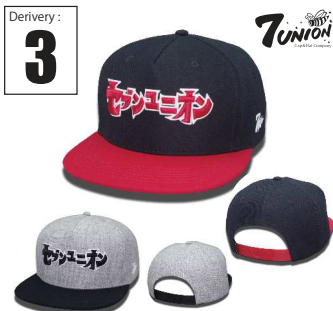
ICVW-111 Katakana Derivery: APR Price: ¥ 5500(w/t) Material: 20%Wool 80% Acrylic Color: Black Red / H Gray Black

ポテにコットンツイルを採用したフロントに今期のテーマであるHARD WORK BEATS TALENT (努力は才能を打ち負かす)のワードのみを光でプリントしたアイテムです。クラブ毎編題でワードだけが光るんです。バックにはリアフレクターの紐を編んでベルトを作りました何れも何れもONLY 7UNIONです。