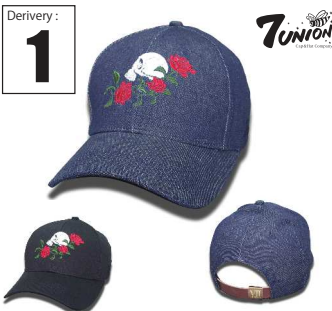
ICVW-101 Rose Skull Bent Derivery: FEB Price: ¥ 5000(w/t) Material: 100% Cotton Color: Denim / Black

フロントパネルに縫い付けたベロクロテープの中にブランドロゴを刺繍でON、その上にNYのYellow cabやPOLICEなどで非難を意味するOFF DUTY刺繍ワッペンをベロクロテープで着脱出来る様にしましたアイテムです。