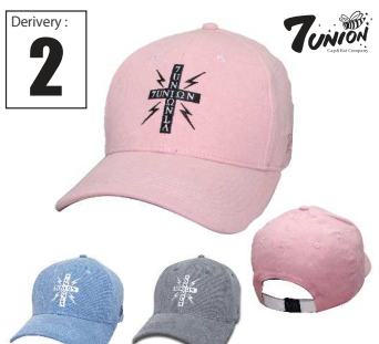
ICVW-105 Cross Union Derivery: MAR Price: ¥ 5000(w/t) Material: 100% Cotton Color: Pink/ Blue/ Black

CAPのフロントに某SK8ロゴをサンプリング、ロゴの下にKAMIKAZEと今期のミクスチャー要素を盛り込んだアイテムです。