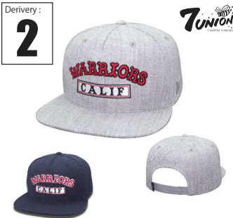
ICVW-106 Calif Warriors Derivery: MAR Price: ¥ 5800(w/t) Material: 20%Wool 80% Acrylic Color: H Gray / Navy

毎回好評を頂いているTEAMシリーズ、今期も面白いチームを加えました！1発目はCALIF WARRIORSです。フロントにボックスロゴとチーム名がアーチでバランスよく配置されたデザインは全てのコーディネートにハマるはず。