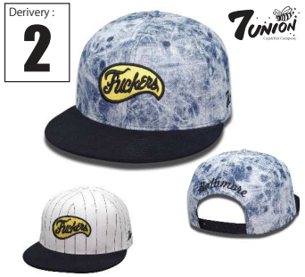
ICVW-107 Baltimore Fuckers Derivery: MAR Price: ¥ 5800(w/t) Material: 100% Cotton / 20%Wool 80% Acrylic Color: Snow Wash Denim x Black White Stripe x Black

毎回好評を頂いているTEAMシリーズ、今期も面白いチームを加えました！1発目はCALIF WARRIORSです。フロントにボックスロゴとチーム名がアーチでバランスよく配置されたデザインは全てのコーディネートにハマるはず。