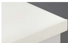
アクリルストーンワークトップ(ソリッド)