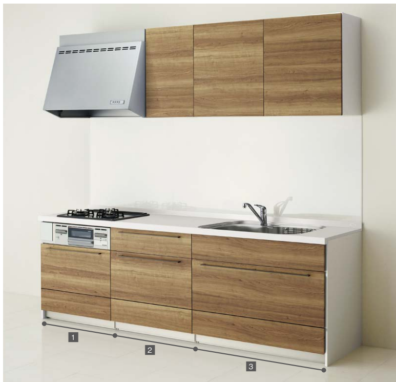
写真のセットは間口255cm、扉は class 4 / チェリーブレンドです。(金額にクリン壁パネルは含まれておりません。)