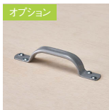
オプション スチール取手 S-TT ¥1,500

シナ合板 単板の表面にシナ材を張り、クリア塗装をした素材です。 ※テーブルクロスの使用を前提にご利用ください。