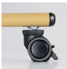
■アジャスト機能付キャスター

ABS樹脂エッジ(EB) 硬質タイプの樹脂エッジで耐久性・密着性に優れています。