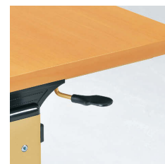
■折りたたみ操作レバー