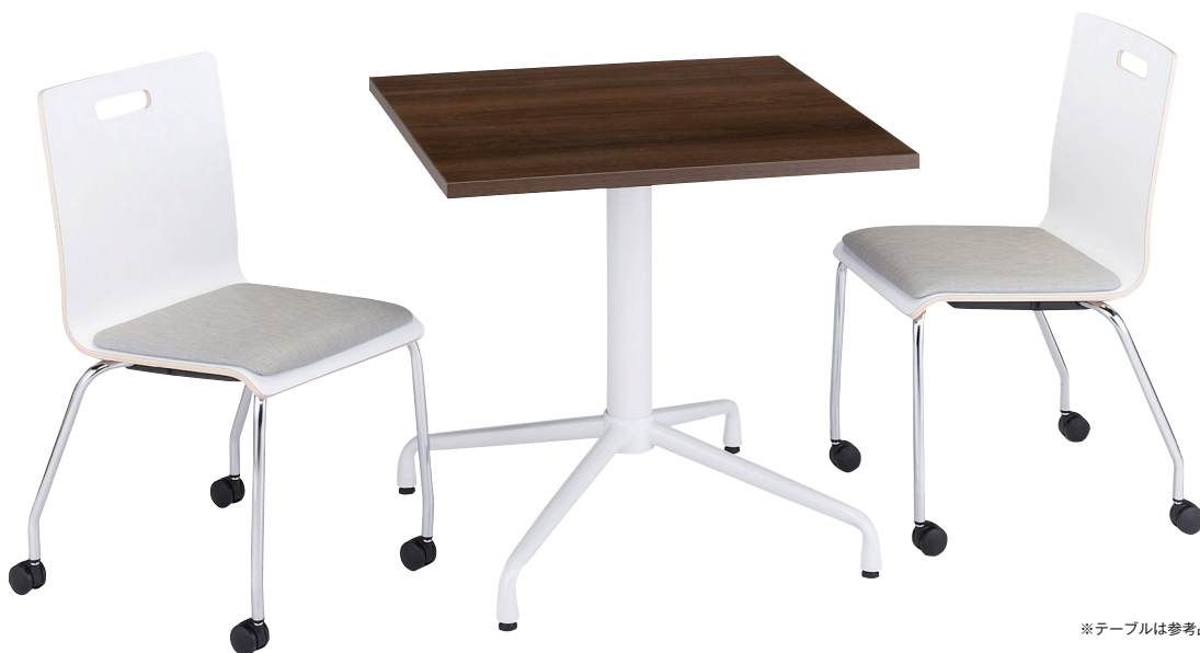
※テーブルは参考品