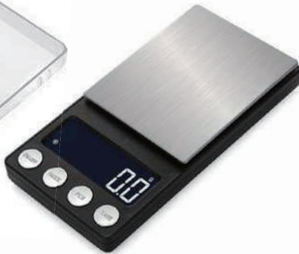
デジタルスケール本体