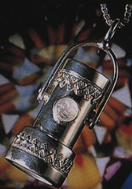
KALEIDO SCOPE with GEMSTONE ¥180,000