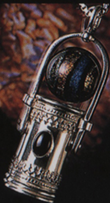
DELUXE BEAD-O SCOPE with GEMSTONE ¥87,000