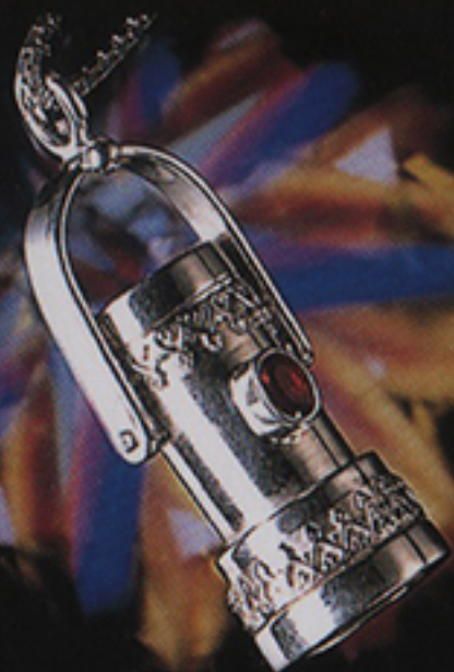
KALEIDO SCOPE with GEMSTONE ¥190,000