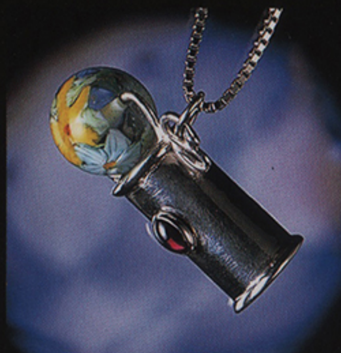
BEAD-O SCOPE with GEMSTONE ¥43,000