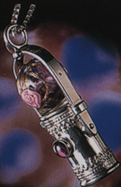
DELUXE BEAD-O SCOPE with GEMSTONE ¥85,000