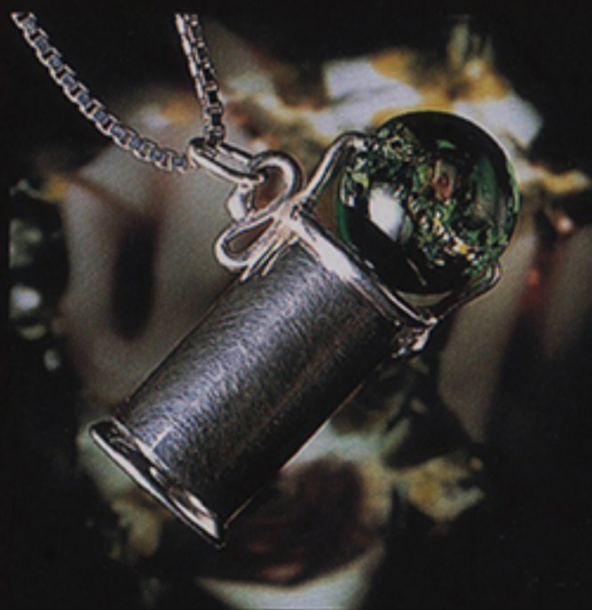
BEAD-O SCOPE ¥33,000