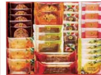
スイーツファクトリー 28号