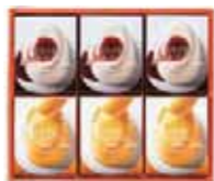
とろけるプリン -カスタード&マンゴー- 6号