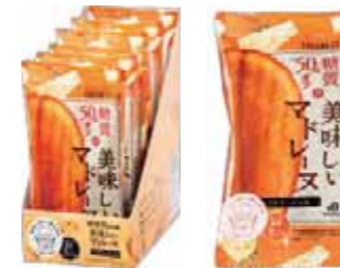
ロカボ・スタイル フロマージュマドレーヌ