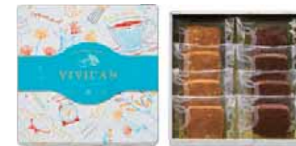
お菓子の封入状態はイメージです。