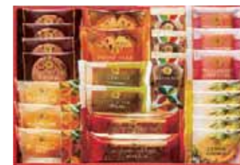
スイーツファクトリー 24号