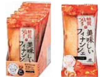
ロカボ・スタイル メープルフィナンシェ