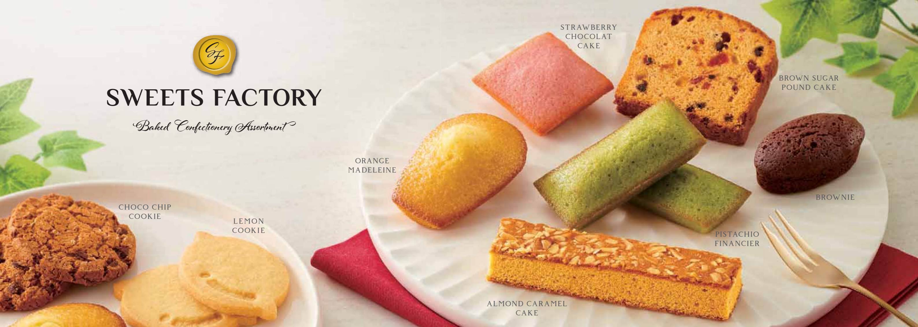
CHOCO CHIP COOKIE