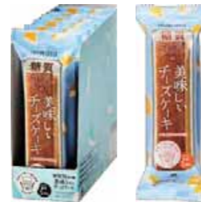
ロカボ・スタイル チーズケーキ