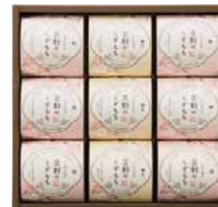
吉野のくずもち 9号