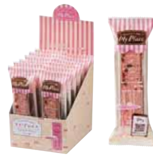
おうちでカフェ気分 マイ・プレイス ミックスベリーケーキ