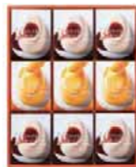
とろけるプリン -カスタード&マンゴー- 9号