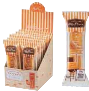
おうちでカフェ気分 マイ・プレイス オレンジケーキ