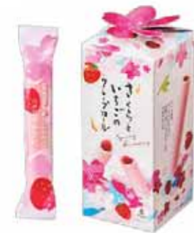
さくらいちごのクレプロール 8号