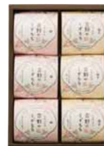
吉野のくずもち 6号