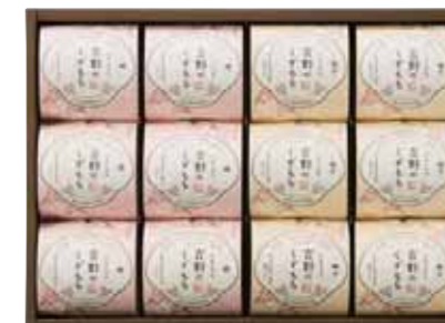
吉野のくずもち 12号