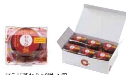
ほうじ茶わらび餅 1個