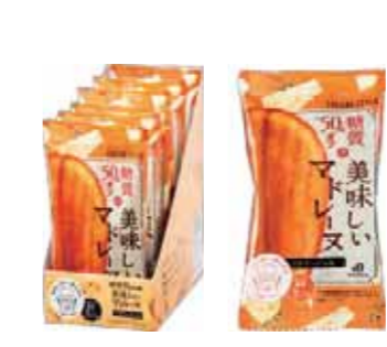
フロマージュマドレーヌ 糖質 5.1%