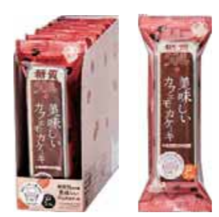
カフェモカケーキ 糖質 5.3%