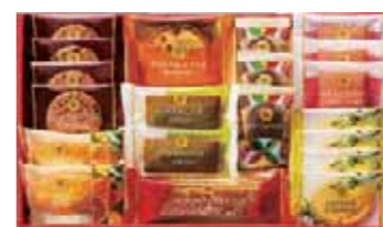
スイーツファクトリー 20号