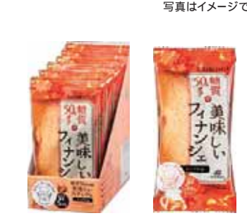
メープルフィナンシェ 糖質 5.0%