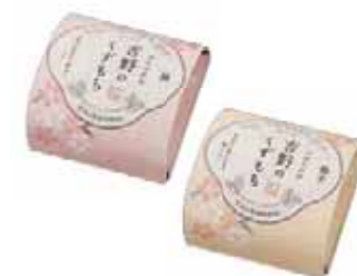
バラ 吉野のくずもち