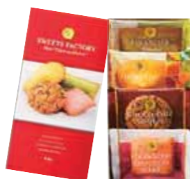
スイーツファクトリー 4号