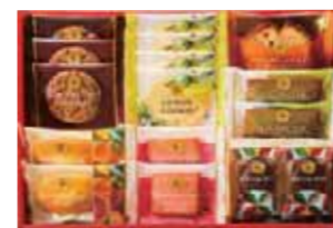
スイーツファクトリー 16号