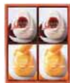
とろけるプリン -カスタード&マンゴー- 4号

アルフォンソマンゴーを使ったとろける食感のプリン。 芳醇なマンゴーの香りが口の中に広がります。