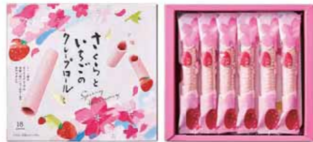
さくらいちごのクレプロール 18号