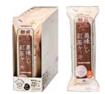
紅茶ケーキ 糖質 5.4%

華やかに香り立つアールグレイの茶葉を選びました。午後のひとときを彩る、紅茶の優しい味わい。