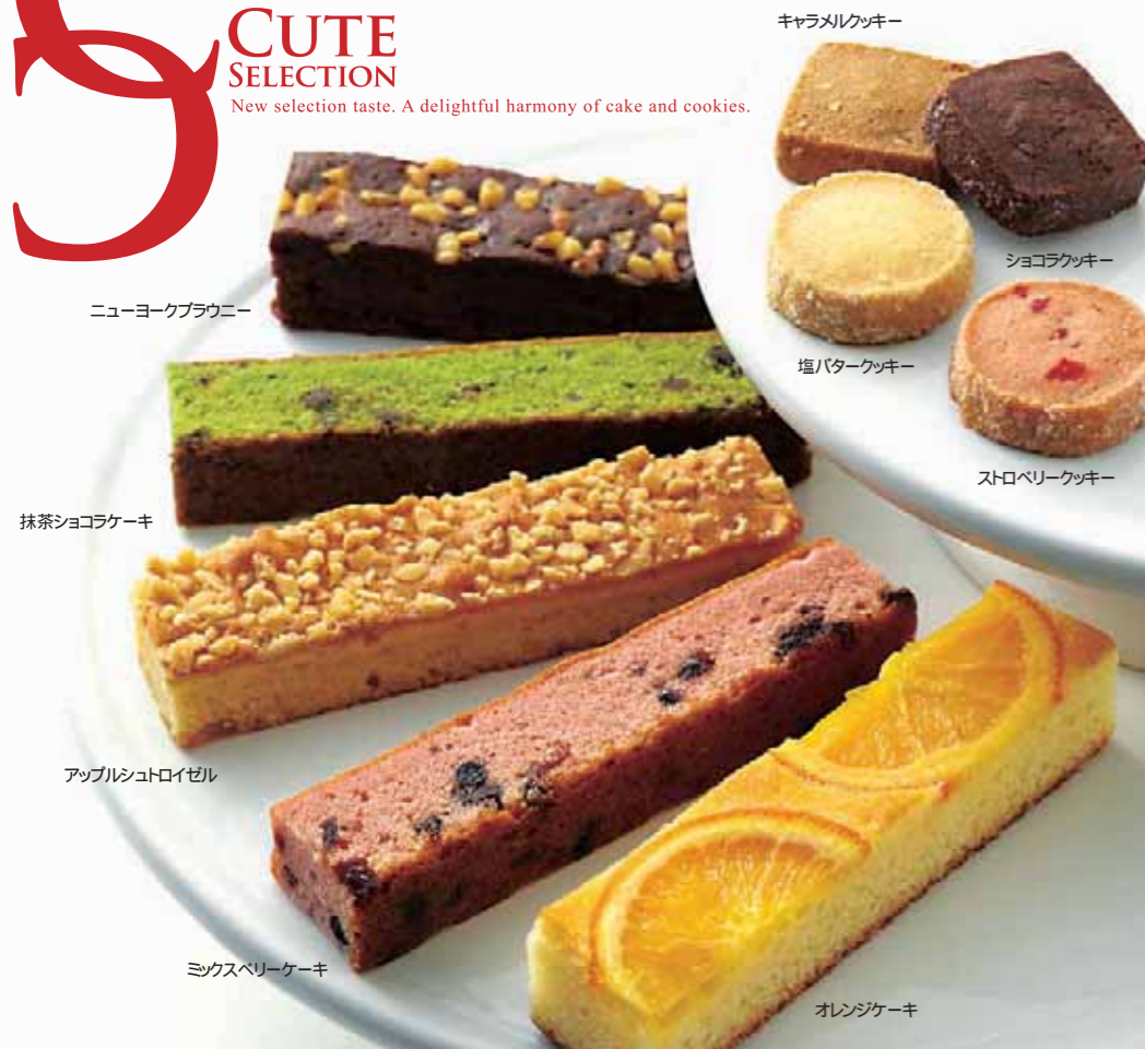
ニューヨークブラウニー