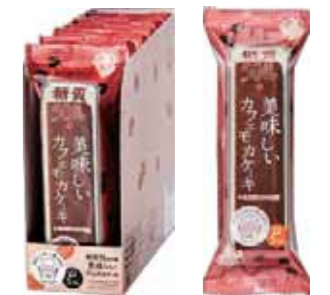
ロカボ・スタイル カフェモカケーキ