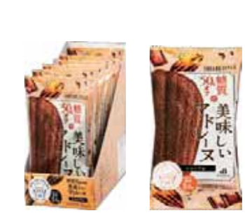
ショコラマドレーヌ 糖質 5.5%