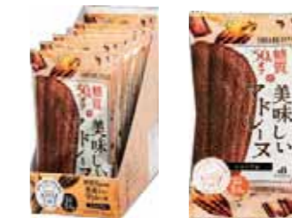
ロカボ・スタイル ショコラマドレーヌ