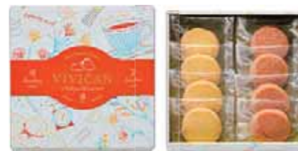
お菓子の封入状態はイメージです。