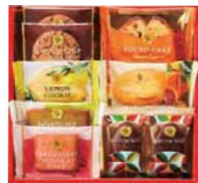
スイーツファクトリー 9号