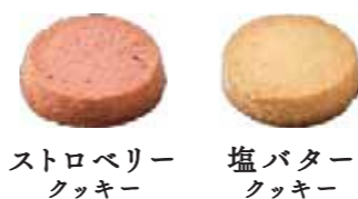
ストロベリークッキー 塩バタークッキー

素材の美味しさをとじ込めた可愛いミニクッキーを詰め合わせました。 大人可愛いデザインの魅力的な缶が日常をビビッドに彩ります。