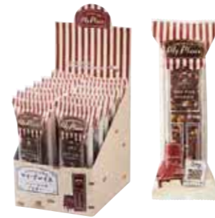
おうちでカフェ気分 マイ・プレイス ニューヨークブラウニー