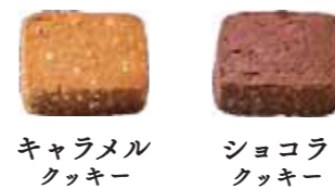
キャラメルクッキー ショコラクッキー

苺の果肉を混ぜ込んだフルーティーで甘酸っぱい苺クッキーと、ゲランドの塩が隠し味のさっぱり香ばしいバタークッキー。