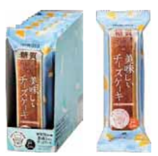
チーズケーキ 糖質 5.6%

おいしく、おしゃれに、美しく お菓子には、美味しさと、こだわりは外せない。 私らしいスタイルで楽しむ、 糖質のことを考えたスイーツ。