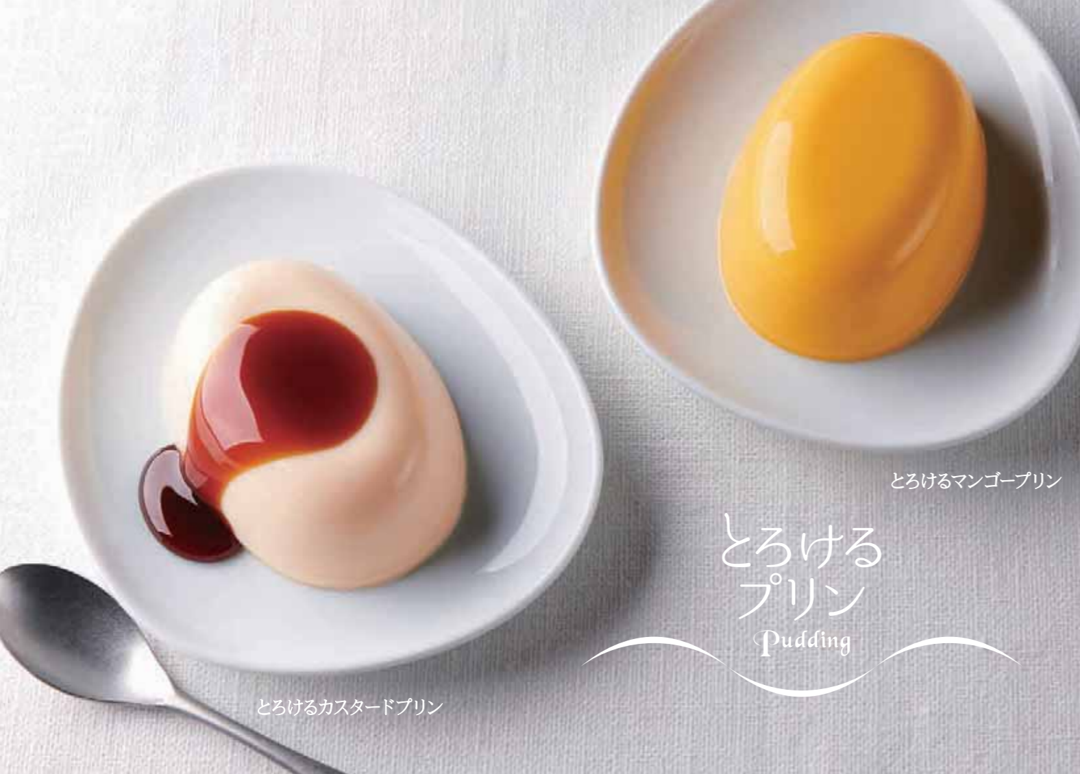
とろけるカスタードプリン