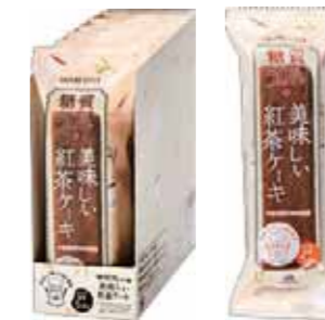
ロカボ・スタイル 紅茶ケーキ