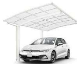
51-27 H24 ホワイト色(ポリカ屋根ふき材: トーメイマット色)