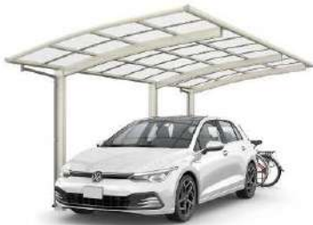
J51-14-27 H24 プラチナステン色(ポリカ屋根ふき材: トーメイマット色)