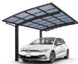
51-27 H24 カームブラック色(熱線遮断ポリカ屋根ふき材: アースブルー色)