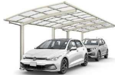
J51-14-27 H24 プラチナステン色(ポリカ屋根ふき材: トーメイマット色)