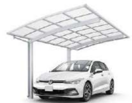
51-27 H24 ピュアシルバー色(ポリカ屋根ふき材: トーメイマット色)