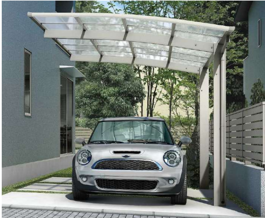
51-27 H24 プラチナステン色(ポリカ屋根ふき材: トーメイマット色)

※不燃認定屋根ふき材(アルミ樹脂複合板)、および熱線遮断FRP板(DR認定品)もご用意しています(▶P.1098)。詳しくは当社営業所にお問い合わせください。