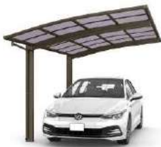
51-27 H24 ブラウン色(ポリカ屋根ふき材: スモークブラウン色)