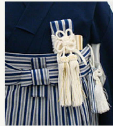
懐剣をおまもりの横、 袴と着物の間に入れる。