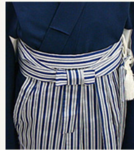
右紐を豊んだ紐の中心に くるよう紐を2-3回巻きます。