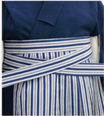
袴の左右の紐を後ろに回し 中心位置で交差させる。