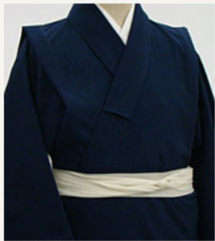
長襦袢の上に着物 上前を合せ、腰紐を締める。