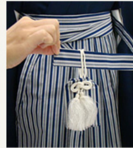
向かって右側の紐に おまもりを通す。