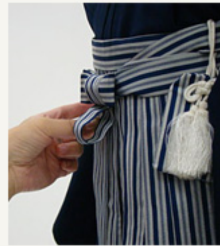
十文字に形を整えます。