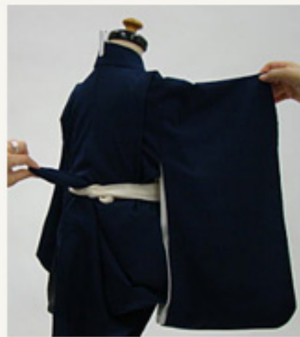
着物背中心の裾を下に持つ