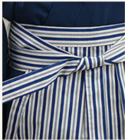
下になった紐をもう一度 前紐にからめます。