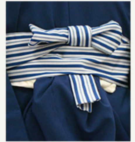
手先を垂れ中心にかぶせ 2回巻き残りは帯の下へ通す。