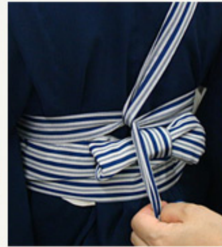
後ろで紐を十文字に結ぶ。