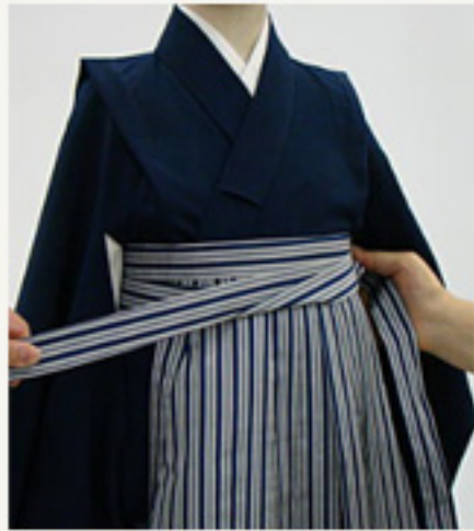
交差させた紐を後ろに まわす。