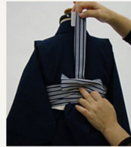
下の垂れを20-25cmの巾で たたむ。