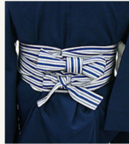
下帯のしたに蝶著結び します。