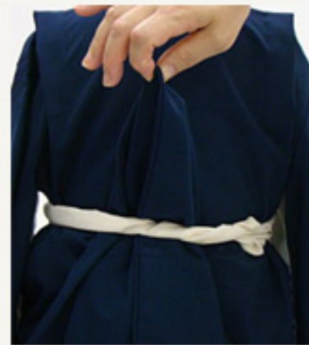
裾下を腰紐の下から通し 上へかける。