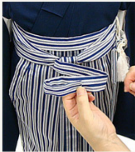
左の紐を紐巾の3倍の 長さにし中に折り込みます。