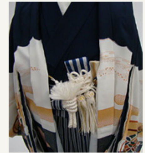
羽織紐を付け 再度全体を整え完成。