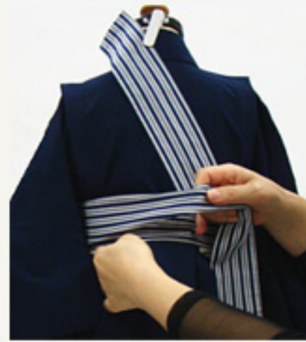
下帯の手元を40cmくらい 残し2回まく。