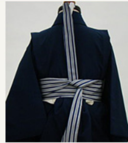
後中心で手元を垂れに重ね ひと結び、一文字に結ぶ。