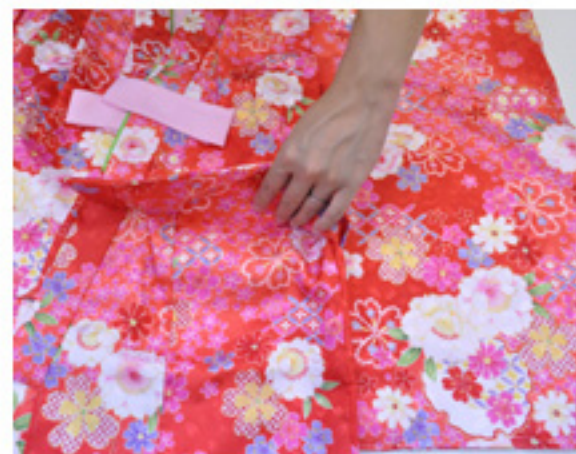
〔2〕腰あげ寸法の半分の長さを測り、イから上へ測った長さの部分(左図ハ)とイから下へ測った長さの部分(左図ニ)を決めます。〔3〕イの部分をつまみ上げ、ハとニを縫い合わせて完成です。

腰あげは大人と同じように、腰紐を使って着付けの時に同時にする方法もあります。右図では、ご家庭でされる際の(肩あげ・腰あげ)を紹介しております。