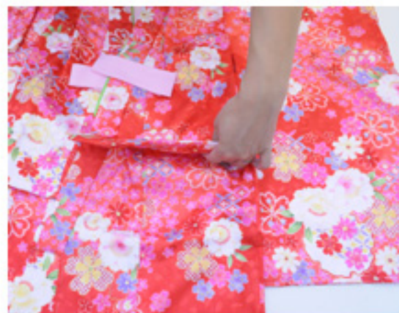
〔1〕肩から着丈の6/10のところ(左図イ)と裾から着丈の4/10のところ(左図ロ)を決めます。※イとロの間の長さが腰あげ寸法です。