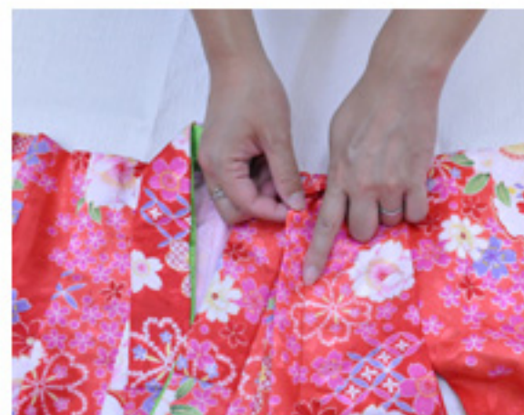
〔2〕①でつまんだ根本を縫い合わせ、あげ山を袖口に倒して完成です。