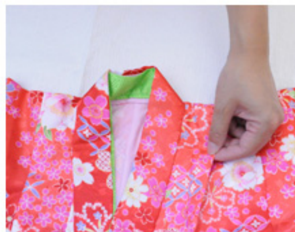
〔1〕肩幅の1/2部分を袖付けと平行に、前の袖つけどまりの横から後ろの袖つけどまりの横までつまみます。(ここをあげ山といいます)