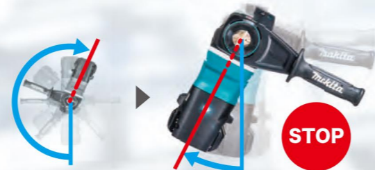
AFT非搭載機イメージ