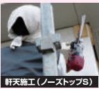
軒天施工(ノーストップ)