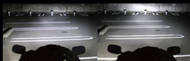
※ロービームへの設置イメージ