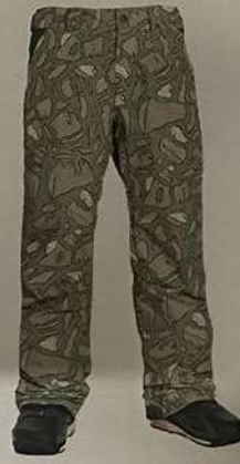
BC Green Critterflage