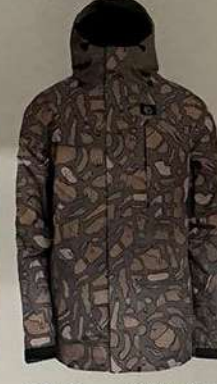
BC Green Critterflage