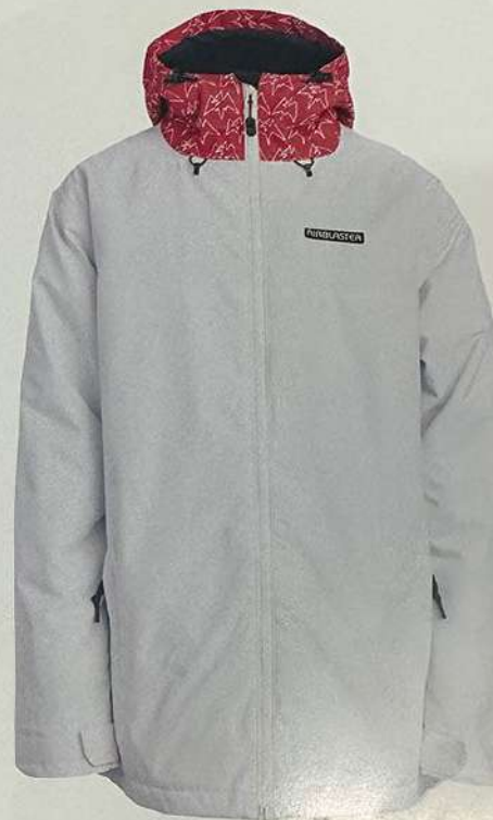
White Cherry Terry