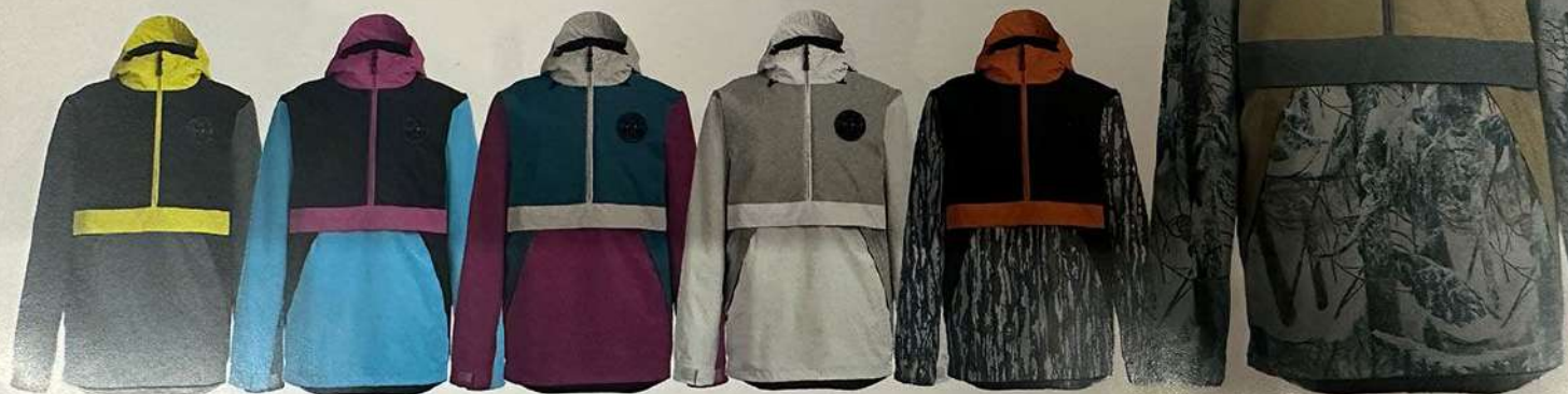
Vintage Black / Safety Black

PRICE: 49,000yen (税込価格 53,900yen) ※REALTREE ORIGINAL™は51,000yen (税込価格 56,100yen)