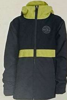
Black / Safety

着脱しやすいフルレングスのフロントジッパーを採用し、新しく生まれ変わったYouth Trenchoverは、当社の最も象徴的なAirblaster スノーボードジャケットのスタイルと機能をそのままに、パッケージ全体を小型化したものです。このジャケットは、小さくなるにつれて振動数が増幅され、最もハードなミニシュレッドの無限のエネルギーに対応します。15Kウォータープルーフ、60gインサレーション、そして視認性に優れたブライトフードを採用。G.R.O.W.システム標準装備。