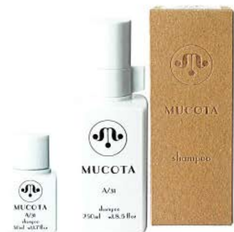
50ml ¥700 250ml ¥2800

ダメージヘアもしっかり洗い上げ、 頭皮に適度な潤いを与える。 水分を維持しやすいベースを作ります。