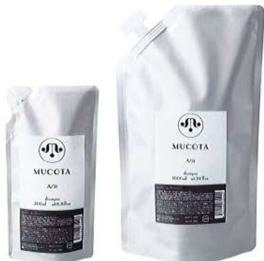
200ml ¥2000 1000ml ¥8000

【洗淨成分】スイートアーモンドオイル誘導体 / アルガンオイル誘導体 / コラーゲン誘導体 【 香り 】天然感のあるローズにホワイトムスクを加えたエレガントローズの香り