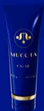
ライブルミネスタ カラーストレートプラス CS+MD