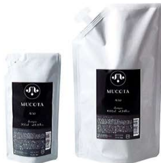
200ml ¥2000 1000ml ¥8000

【洗淨成分】オリーブオイル誘導体 / アルガンオイル誘導体 / シルク誘導体 【 香り 】天然感のあるローズにホワイトムスクを加えたエレガントローズの香り