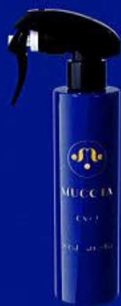
ライブルミネスタ カラーストレートプラス CS+2