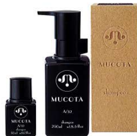
50ml ¥700 250ml ¥2800

皮脂を取りすぎずマイルドに洗い上げ、 ツヤのあるサラサラヘアに。 髪のをベースを整えます。