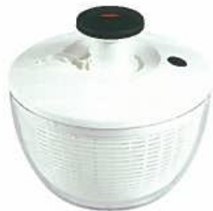
1998年 おもちゃの仕掛けをヒントに、 初代サラダスピナー誕生。