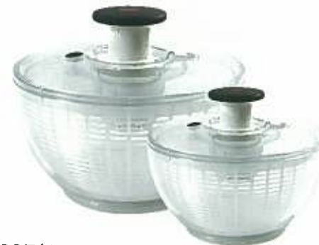
2007年 “お手入れしやすくしてほしい”という 日本からの要望でフタの分解を可能に。