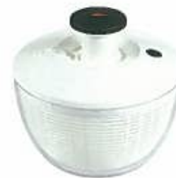
2002年 日本からの要望に応じて、ミニサイズを発売！ アメリカでもヒット商品に。