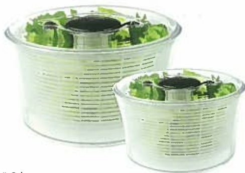
2012年 安定感と収納時の利便性をアップ！ 新サラダスピナー誕生