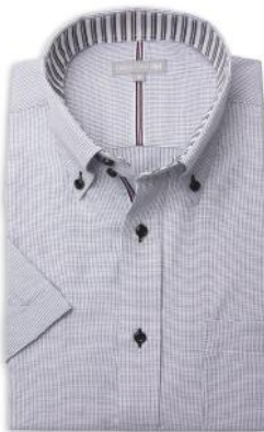
ドウエポッターニ BD SHDH21-08