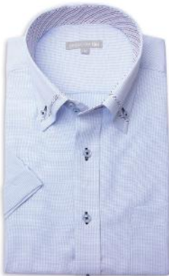
ドウエ/マイター BD SHDH21-07