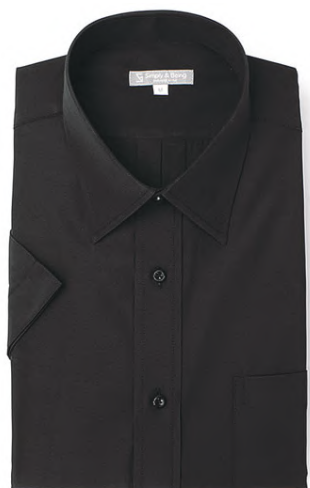
レギュラーカラー XS011