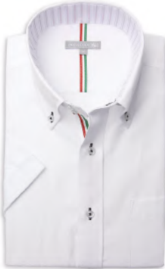
ドウエポッターニ BD SHDH21-04