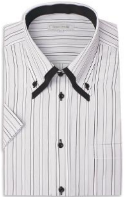
2枚衿 ドゥエ ボタンダウン ZA039