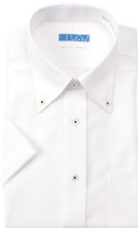
ボタンダウン ホワイト ドビーチェック EHTO01-03