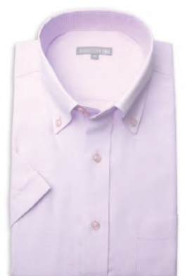
ドウエポッターニ BD SHDH21-06