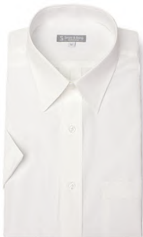
レギュラーカラー XS001