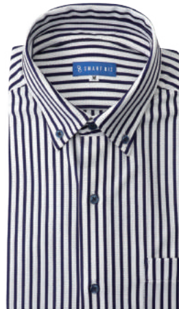
ボタンダウン ネイビー ストライプ