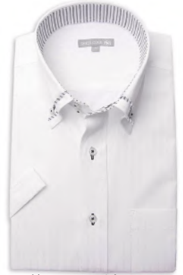
ドウエ/マイター BD SHDH21-03