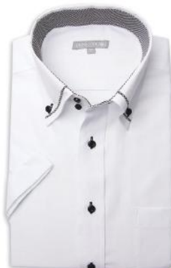
ドウエ/マイター BD SHDH21-05