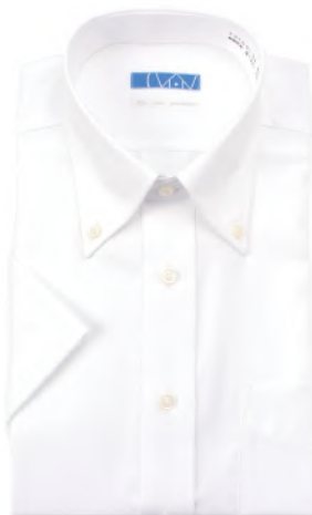
ボタンダウン ホワイト ツイル EHTO01-04