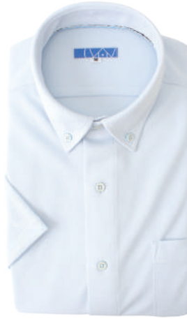
ボタンダウン サックス