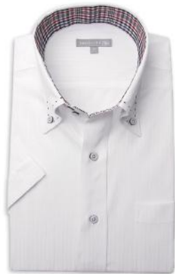
ドゥエポッターニ BD SHDH21-10