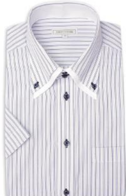
2枚衿 ドゥエ ボタンダウン ZA022