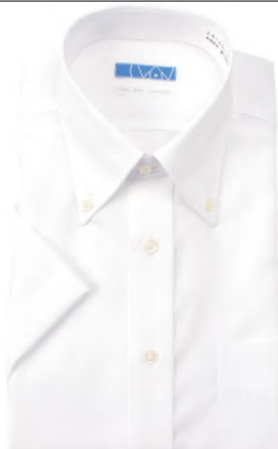
ボタンダウン ホワイト ブロード 無地 EHTO01-01