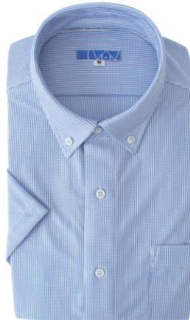
ボタンダウン サックス ストライプ