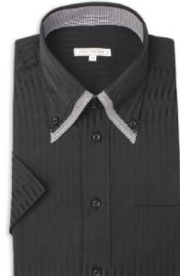
2枚衿 ドゥエ ボタンダウン ZA025