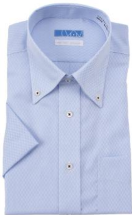
ボタンダウン サックス ドビーチェック柄 EHTO01-07