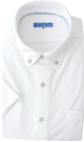
ボタンダウン ホワイト