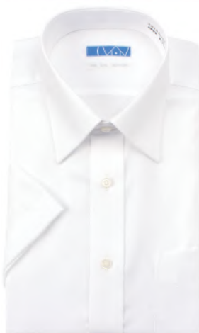
セミワイドカラー ホワイト ツイル EHTO01-05