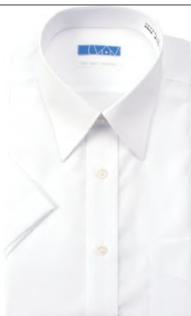
レギュラーカラー ホワイト ブロード 無地 EHTO01-02