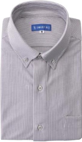
ボタンダウン グレー ストライプ EXTO20-73