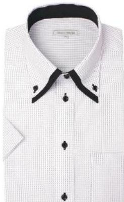
2枚衿 ドゥエ ボタンダウン ZA016B