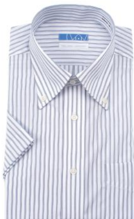
ボタンダウン ネイビー 平織りストライプ EHTO01-09