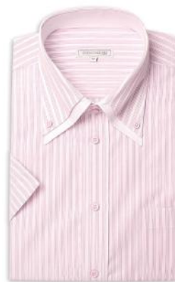
2枚衿 ドゥエ ボタンダウン ZA053