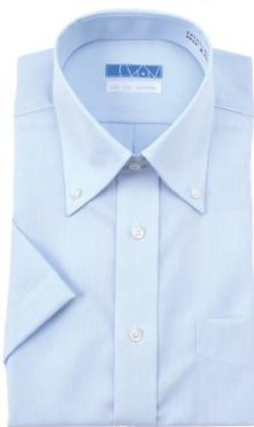
ボタンダウン ブルー ブロード EHTO01-06