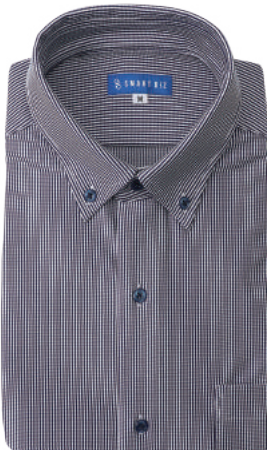
ボタンダウン ネイビー ストライプ