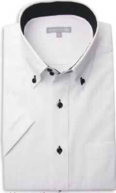
ドウエポッターニ BD SHDH21-01