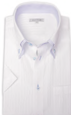
2枚衿 ドゥエ ボタンダウン ZA024