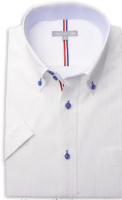
ドウエポッターニ BD SHDH21-02