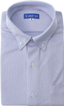
ボタンダウン ブルー