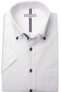
ドウエポッターニ BD SHDH21-09