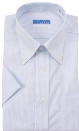
ボタンダウン ブルー 平織りストライプ EHTO01-08