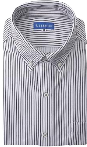
ボタンダウン ブラック ストライプ EXTO20-83