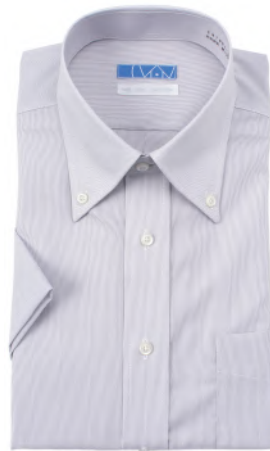
ボタンダウン グレー 平織りストライプ EHTO01-10