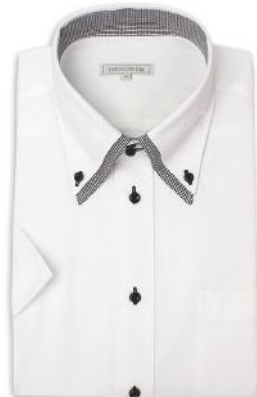
2枚衿 ドゥエ ボタンダウン ZA020