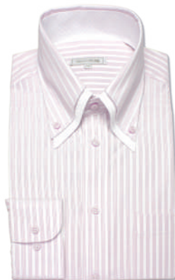
2枚衿ボタンダウン SHIRT-Z053