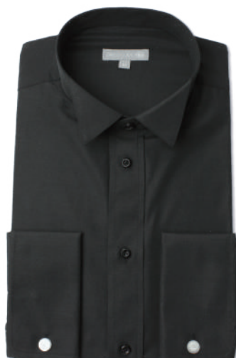
ウィングカラー SHDC40-15 ※ダブルカフス