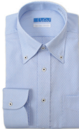
ボタンダウン ブルー ドビーチェック EATO22-06