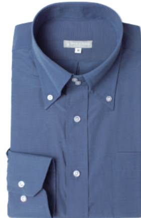
ドゥエ ボタンダウン SB-DB4001