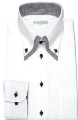
2枚衿ボタンダウン SHIRT-Z046