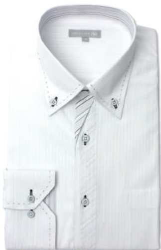
変形前立て ボタンダウン SHDZ20-10

素材：綿 25% ポリエステル 75% サイズ展開：スリム(S~L)・ノーマル(S~3L)