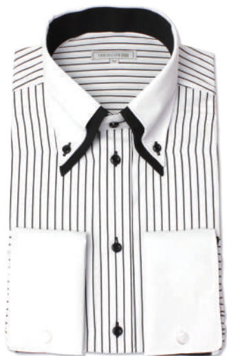
2枚衿ボタンダウン SHIRT-1009