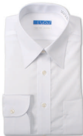
レギュラーカラー ホワイト ブロード無地 EATO22-01