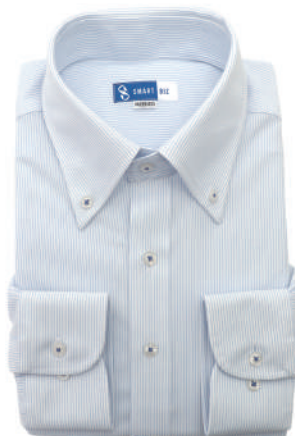
ボタンダウン ブルー ストライプ EWTO01-12