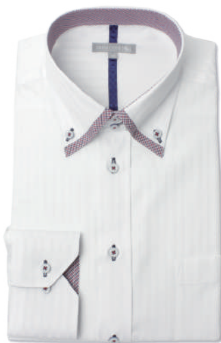
フェイク 2枚衿ドゥエ ボタンダウン SHDZ20-13