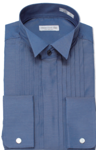
ウィングカラー SHDC40-16 ※ダブルカフス