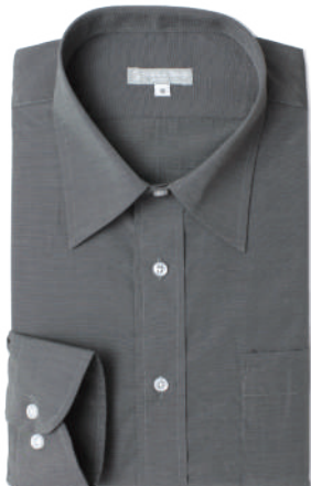
レギュラーカラー SB-RG4002