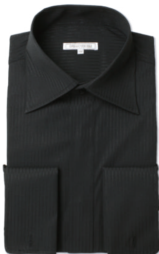
ドゥエ ワイドカラー SHIRT-4009