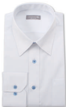
レギュラーカラー SHDZ15-11