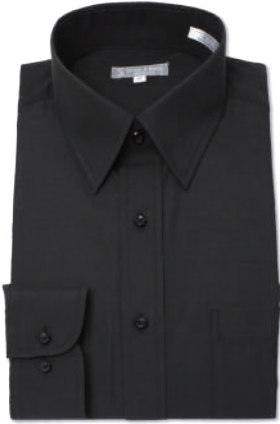
レギュラーカラー SHIRT-XR011