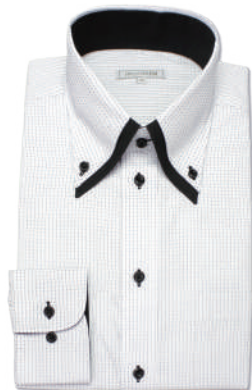
2枚衿ボタンダウン SHIRT-Z016

素材：綿 25% ポリエステル 75% サイズ展開：スリム (S~L)・ノーマル (S~3L)