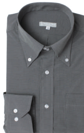
ドゥエ ボタンダウン SB-DB4002