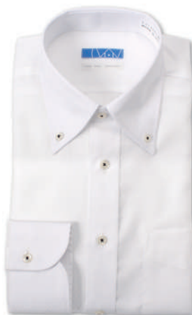
ボタンダウン ホワイト ドビーチェック EATO22-04