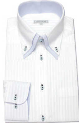
2枚衿ボタンダウン SHIRT-Z065