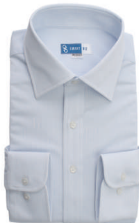
ワイドカラー ブルー ストライプ EWTO01-11