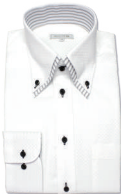
2枚衿ボタンダウン SHIRT-Z034