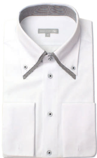
2枚衿ドゥエ ボタンダウン SHIRT-2003