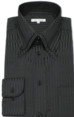
2枚衿ボタンダウン SHIRT-Z049