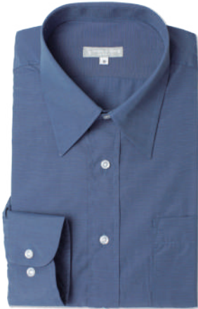
レギュラーカラー SB-RG4001