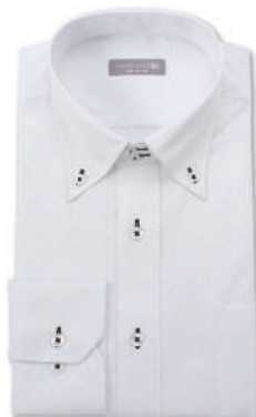
ドゥエ ボタンダウン SHDZ15-12