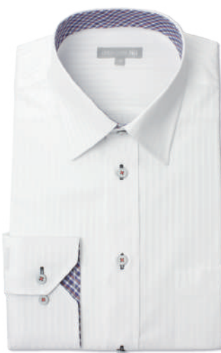
レギュラーカラー SHDZ20-15