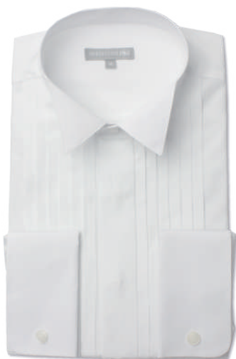
ウィングカラー SHIRT-4012 ※ダブルカフス