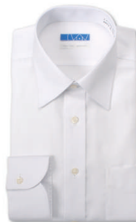
セミワイドカラー ホワイト ドビー ツイル EATO22-09