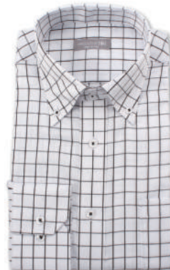
ドゥエ ボタンダウン SHDZ15-18