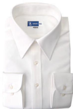
レギュラーカラー ホワイト 無地 EWTO01-06