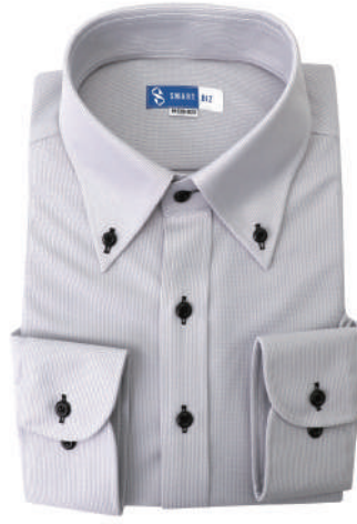
ボタンダウン グレー ストライプ EWTO01-74