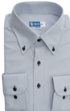
ボタンダウン ネイビー ストライプ EWTO01-16