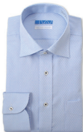
ワイドカラー ブルー ドビーチェック EATO22-05