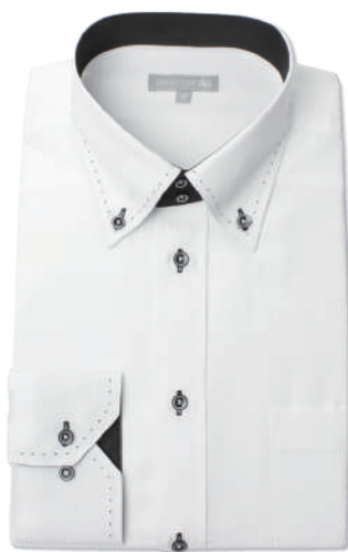
ドゥエ ボタンダウン SHDZ20-11