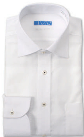
ワイドカラー ホワイト ドビーチェック EATO22-03