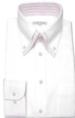
2枚衿ボタンダウン SHIRT-Z052