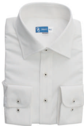
ワイドカラー ホワイト ストライプ EWTO01-04