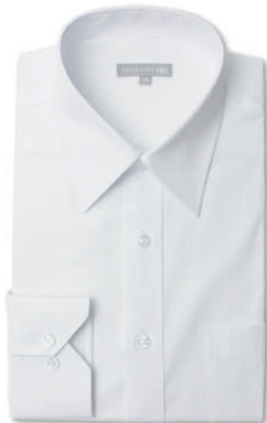
レギュラーカラー SHDZ12-00