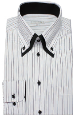
2枚衿ボタンダウン SHIRT-Z039