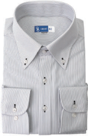
ボタンダウン グレー ストライプ EWTO01-72