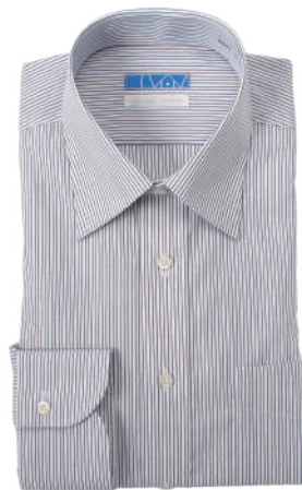
セミワイドカラー ネイビー 平織りストライプ EATO22-07