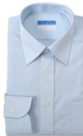
セミワイドカラー ブルー ドビー ツイル EATO22-11