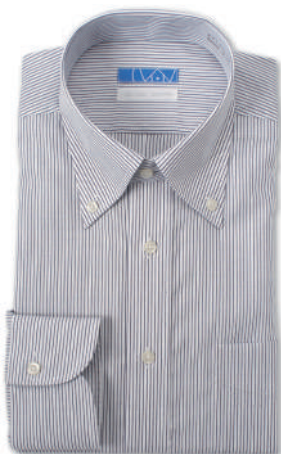
ボタンダウン ネイビー 平織りストライプ EATO22-08