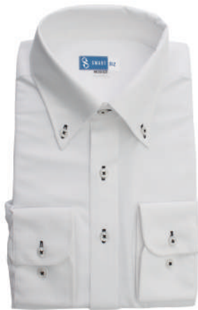
ボタンダウン ホワイト ストライプ EWTO01-05