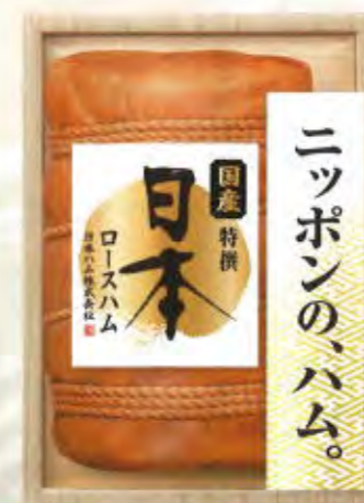
JPN-50 本体価格 5,000円 (税込5,400円) 布巻き 特撰ロースハム 600g 要冷蔵