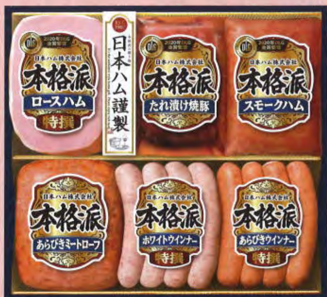
NH-456 本体価格 4,000円 (税込4,320円) 特撰ロースハム 180g / たれ漬け焼豚 180g / スモークハム 180g あらびきミートローフ 170g / 特撰ホワイトウインナー 80g / 特撰あらびきウインナー 80g 要冷蔵