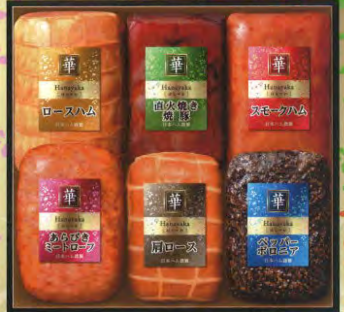
HNA-60 本体価格 5,000円 (税込5,400円) ロースハム 380g / 直火焼き焼豚 180g / スモークハム 180g あらびきミートローフ 170g / 肩ロース 200g / ペッパーポロニア 110g 要冷蔵