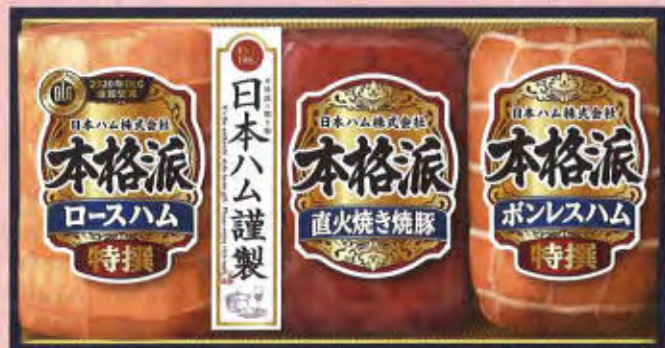
NH-503 本体価格 5,000円 (税込5,400円) 特撰ロースハム 380g / 直火焼き焼豚 180g / 特撰ボンレスハム 200g 要冷蔵