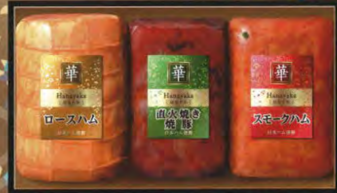
HNA-30 本体価格 3,000円 (税込3,240円) ロースハム 380g / 直火焼き焼豚 180g / スモークハム 180g 要冷蔵