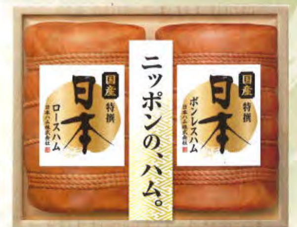
JPN-100 本体価格 10,000円 (税込10,800円) 布巻き 特撰ロースハム 600g / 布巻き 特撰ボンレスハム 650g 要冷蔵