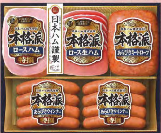
NH-386 本体価格 3,000円 (税込3,240円) 特撰ロースハム 180g / ロース生ハム 40g / あらびきミートローフ 170g 要冷蔵