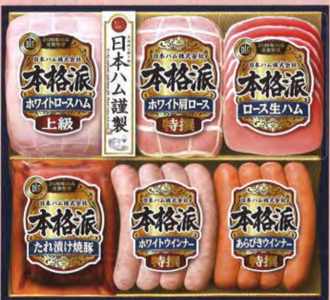
NH-509 本体価格 5,000円 (税込5,400円) 上級ホワイトロースハム 380g / 特撰ホワイト肩ロース 200g / ロース生ハム 40g たれ漬け焼豚 180g / 特撰ホワイトウインナー 80g / 特撰あらびきウインナー 80g 要冷蔵