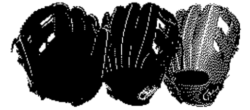
内野用 FG-47NIR サイズ9 ポケット深いモデル