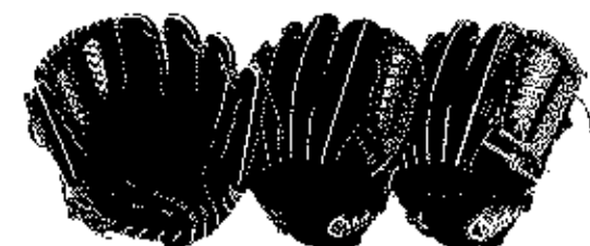
内野用 1G-47UHB (47IHBのウェブ違い)