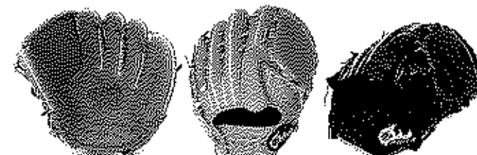
投手用 FG-78N7R サイズ11 横握りモデル