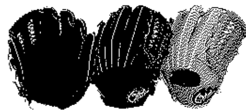
内野用 1G-47NUR (47NIRのウェブ違い)