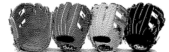
内野用 45型 サイズ9 深いポケットモデル