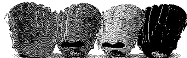
投手用 23型 サイズ11 横握りモデル

2 基本モデル、右・左を ご指定下さい。 カタログ掲載のノック、品番、または下記モデルよりお選びください。○○用○○型 (バックスタイル、ラベルの位置、指の長さなどトジは基本モデルと同じになります。)