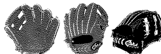
内野用 FG-48IHJ サイズ9 ポケット深いモデル