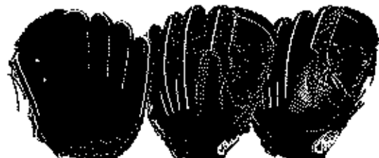
投手用 1G-27KHB サイズ11 横握りモデル

ゼブラレザーシリーズ 本体価格 ¥44,000+税 表革/ステア カラー/ノック、ブラック