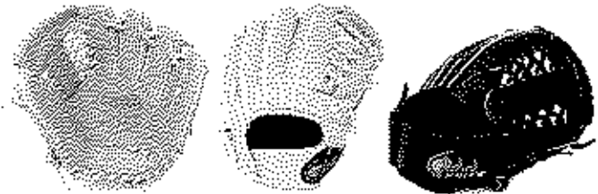
オールラウンド用 FG-83SIRJ サイズM