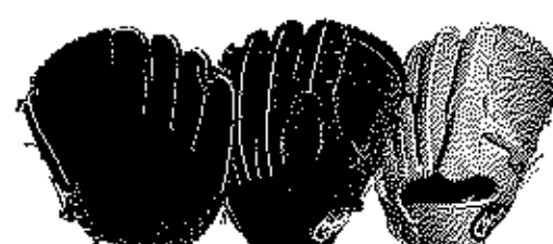
投手用 FG-27NZR (27NKRのウェブ違い)