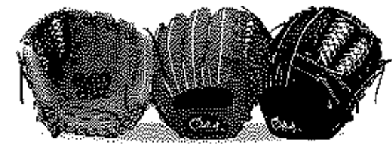
内野用 36型 サイズ9 ポケット浅め幅広いモデル