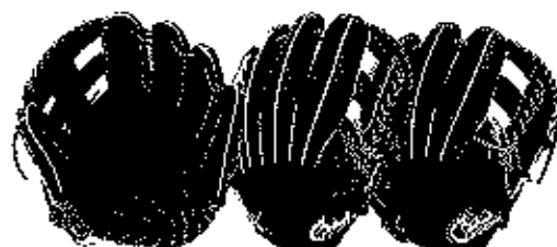
内野用 FG-47L2IHB (47IHBのウェブ違い)