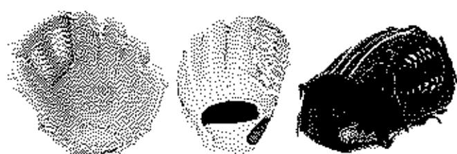
オールラウンド用 FG-84SURJ サイズL