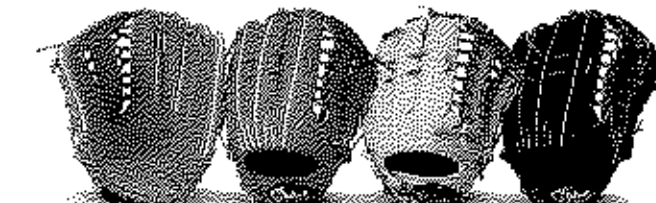
外野用 06型 サイズ17 深いポケットモデル