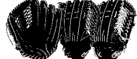
外野用 1G-07FHB サイズ17 ポケット深いモデル