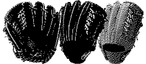
外野用 FG-37NFR サイズ13 ポケット幅広いモデル