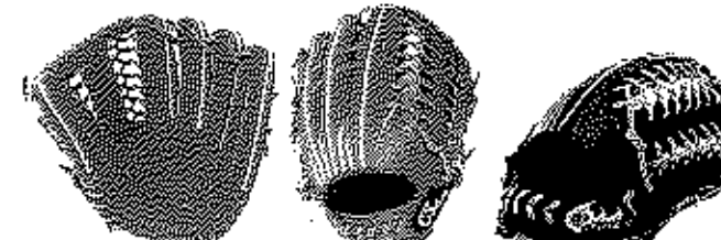
外野用 FG-08GHJ サイズ17 ポケット深いモデル