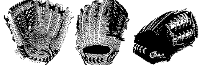
外野用 FG-78NFR サイズ15 ポケット幅広いモデル