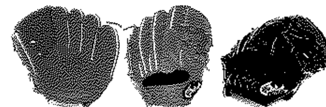
投手用 FG-28KHN リーズ11 横握りモデル