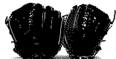
投手用 52型 内野用 69型 外野用 75型

3 本体色 ①~⑪ ①ノック ②ナチュラル ③コルク ④ブラウン ⑤FIRFオレンジ ヘリ色 ①~⑪ ⑥ホワイト ⑦イマロー ⑧レッド ⑨ブルー ⑩ネイビー 紐色 ①~⑪ ⑩オレンジ 縫糸色 ①~⑪⑫⑬⑭⑮ ⑫コルク (USAローハイド) ⑬IRLオレンジ断面白 ⑭ブラック断面白 をご指定下さい。 ⑯シルバー ⑰グリーン ⑱ピンク 本体色が2色以上になる場合は、1色追加ごとに本体価格 ¥1,400+税が加算されます。