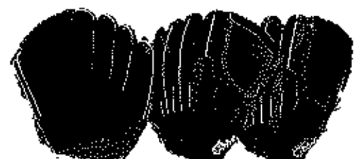
投手用 1G-27ZHB (27KHBのウェブ違い)