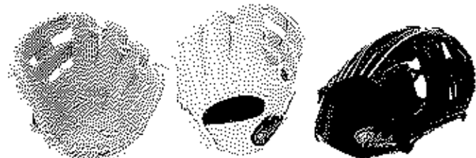
オールラウンド用 FG-84SIRJ サイズL