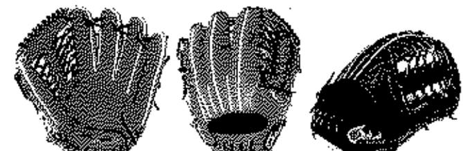
外野用 FG-78FHJ サイズ15 ポケット幅広いモデル