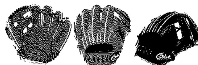
内野用 FG-38IHJ リーズ9 ポケット浅め幅広いモデル