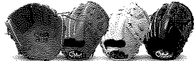
投手用 16型 サイズ11 縦握りモデル