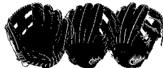
内野用 1G-47IHB サイズ9 ポケット深いモデル