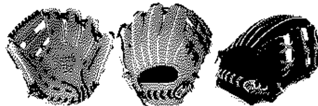
内野用 FG-48NIR リーズ9 ポケット深いモデル