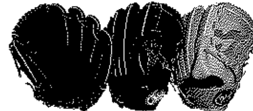
投手用 FG-27NKR サイズ11 横握りモデル

ゼブラレザーシリーズ 本体価格 ¥20,000+税 表革/ステア カラー/ブラック、コルク