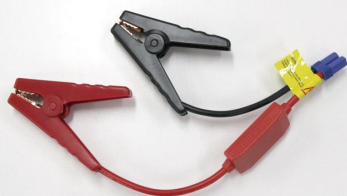
ジャンパーケーブル