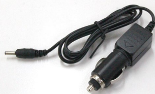
充電用シガープラグ