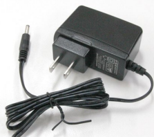
充電用 AC アダプター