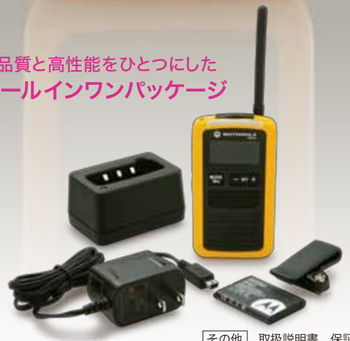
その他 取扱説明書 保証書

MS50の魅力のひとつは、オールインワンパッケージ。本体にリチウムイオン電池パック、充電器、ベルトクリップが同梱されていますので、パッケージを開けたその日からお使いいただけます。繰り返し充電が可能なリチウムイオン電池パックは継ぎ足し充電もでき、ランニングコストも軽減できます。