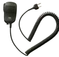
スピーカーマイク JSPMN0001 本体価格 3,600円(税抜)

※マイク/イヤホンを接続した状態で電源を入れたときに、音量が半分以上で設定されていた場合は、聴力障害防止を目的に音量が下がる設定になっています。