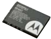
リチウムイオン電池パック (930mAh) BN60 本体価格 3,000円(税抜)

※マイク/イヤホンを接続した状態で電源を入れたときに、音量が半分以上で設定されていた場合は、聴力障害防止を目的に音量が下がる設定になっています。