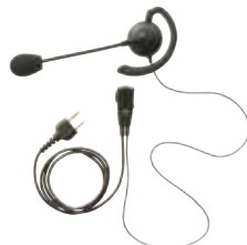
ブームマイクイヤホン JSPRN0003 本体価格 4,800円(税抜)