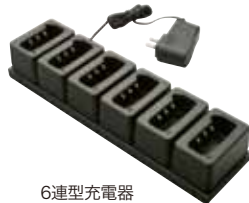
6連型充電器 (ACアダプター付) JCPCN0002 本体価格 18,000円(税抜)