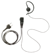
小型タイプマイク&イヤホン JSPRN0001 本体価格 3,800円(税抜)