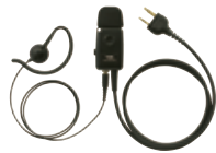
タイプマイク&イヤホン (マイク感度切替え付) JSPRN0002 本体価格 6,000円(税抜)