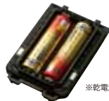
アルカリ単3乾電池ケース (2本使用) JCLN0001 本体価格 1,600円(税抜)