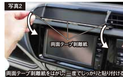
両面テープ剥離紙をはがし、一度でしっかりと貼り付ける

1 取付面の汚れ・ゴミ・油・保護剤等を市販のクリーナー等できれいに拭き取ります。(脱脂作業)