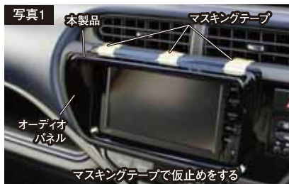
マスキングテープで仮止めをする