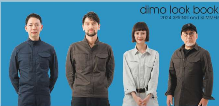
dimo look book 2024 SPRING and SUMMER