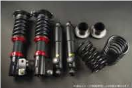
WinnersRun (ウィナーズラン) 車高調整キット スズキ Kei HN11S/HN12S/HN21S/HN22S [SLSP60K-B20-3] 145,000円 (税別)