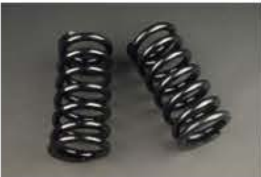
直巻スプリング 2本セット 62φ 200 mm 7K [SKP-SPT6220007-1] 7,000円 (税別)