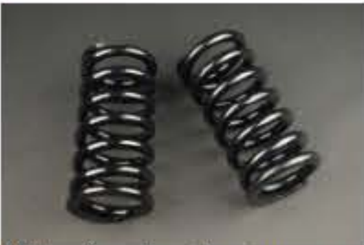
直巻スプリング 2本セット 62φ 200 mm 14K [SKP-SPT6220014-1] 7,000円 (税別)