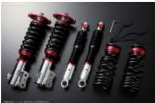
プロスベックワゴン 車高調整キット ダイハツ ムーヴ LA110S(4WD) スタビライザー搭載車 [PND25A-2] 98,000円 (税別)