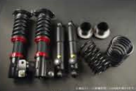
WinnersRun (ウィナーズラン) 車高調整キット スズキ セルボモード CN31S/CP31S [SLSP60G-B20-8] 145,000円 (税別)