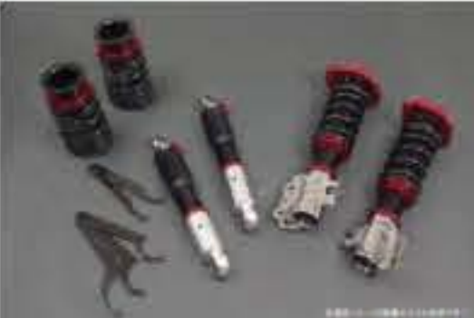
プロスペックライトレース車高調整キット スズキ アルト HA12S/HA12V/HA22S/HA23S/HA23V [PNS59-01] 120,000円 (税別)