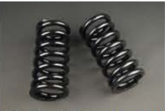
直巻スプリング 2本セット 62φ 200 mm 16K [SKP-SPT6220016-1] 9,800円 (税別)