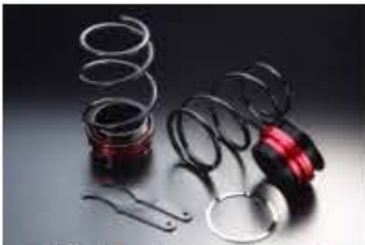
リア車高調キット スバル プレオ LA275F [RKD42-13] 17,000円 (税別)