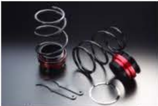
リア車高調キット ダイハツ オプティ L810S/L812S [RKD3-13] 17,000円 (税別)