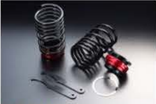
リア車高調キット スズキ ワゴンR M C22S (5型以降) [RKS3-8]