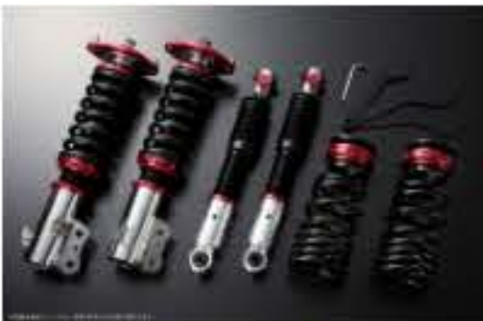
プロスベックワゴン 車高調整キット ダイハツ ムーヴコンテ L585S(4WD) スタビライザー未搭載車 [PND25B-3] 98,000円 (税別)