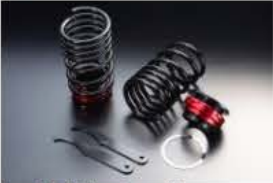
リア車高調キット スズキ スペーシア MK32S [RKS52-6]