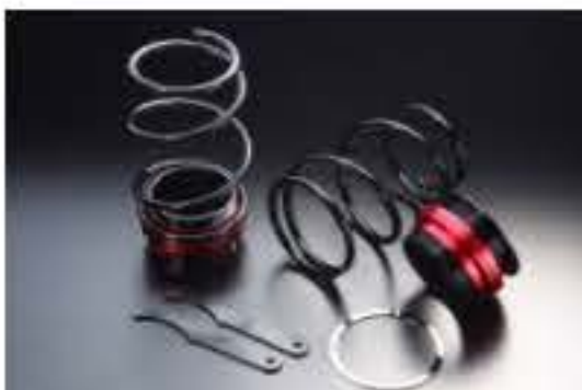
リア車高調キット ダイハツ MAX L950S/L952S [RKD3-17] 17,000円 (税別)