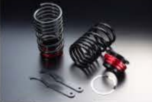
リア車高調キット スズキ Kei HN11S/HN12S/HN21S [RKS6-2] 17,000円 (税別)