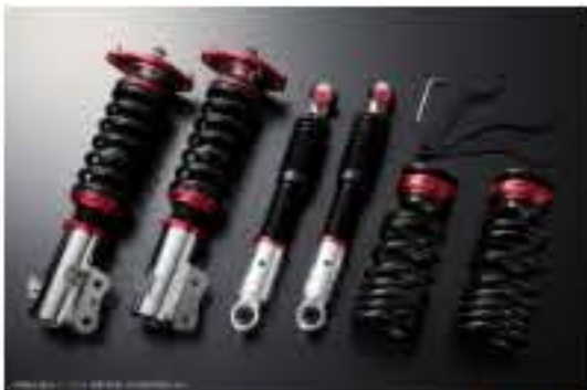
プロスベックワゴン 車高調整キット ダイハツ ムーヴ LA110S(4WD) スタビライザー未搭載車 [PND25B-2] 98,000円 (税別)