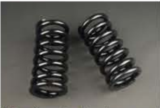
直巻スプリング 2本セット 62φ 220 mm 8K [SKP-SPT6222008-1] 7,000円 (税別)