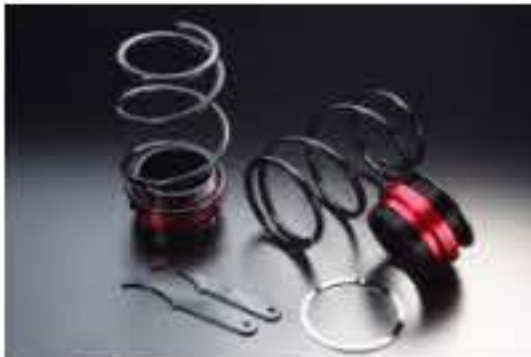
リア車高調キット ダイハツ ソニカ L405S [RKD3-14] 17,000円 (税別)