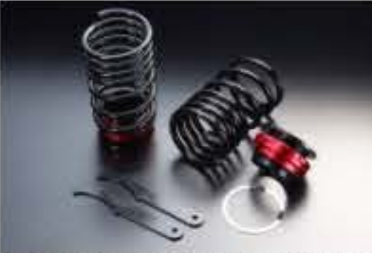
リア車高調キット マツダ フレア M34S [RKS52-9] 17,000円 (税別)