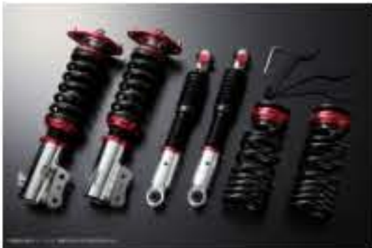
プロスベックワゴン 車高調整キット ダイハツ ムーヴ L185S(4WD) スタビライザー搭載車 [PND25A-1] 98,000円 (税別)