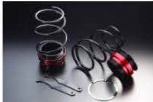
リア車高調キット ダイハツ オプティ L800S/L802S [RKD3-12] 17,000円 (税別)