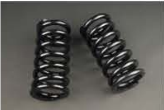
直巻スプリング 2本セット 62φ 200 mm 13K [SKP-SPT6220013-1] 9,800円 (税別)