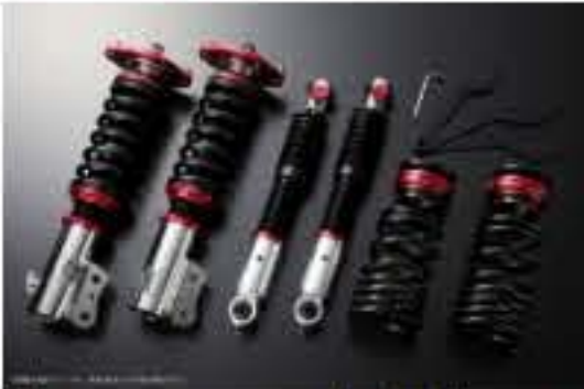
プロスベックワゴン 車高調整キット ダイハツ ムーヴ L185S(4WD) スタビライザー未搭載車 [PND25B-1] 98,000円 (税別)