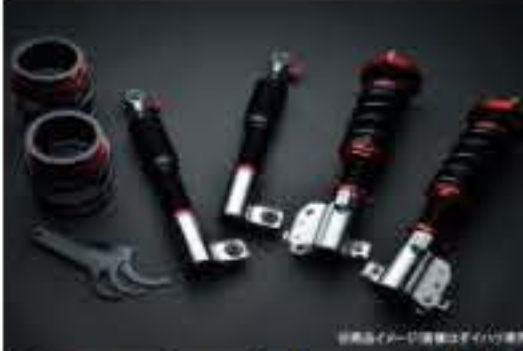
プロスペックライトレース車高調整キット ダイハツ MAX L950S/L952S [PND50-5] 120,000円 (税別)