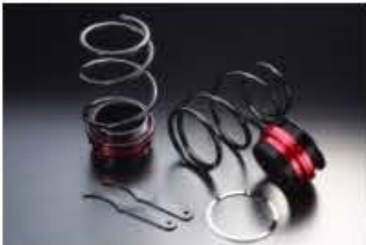
リア車高調キット ダイハツ タント L350S [RKD3-10] 17,000円 (税別)