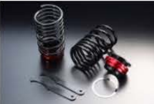
リア車高調キット スズキ ワゴンR CT21S/CT51S/CV21S/CV51S [RKS6-7] 17,000円 (税別)