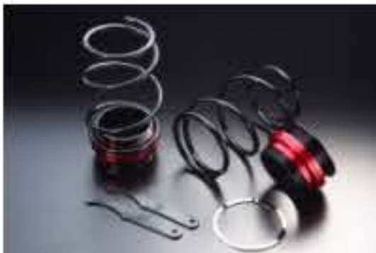
リア車高調キット ダイハツ コペン LA400K [RKD42-11] 17,000円 (税別)