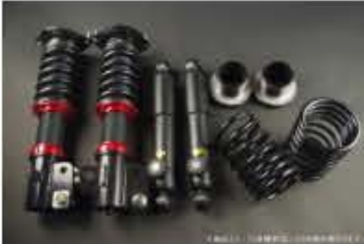
WinnersRun (ウィナーズラン) 車高調整キット スズキ アルト/アルトワークス CR22S/CS22S [SLSP60G-B20-4] 145,000円 (税別)