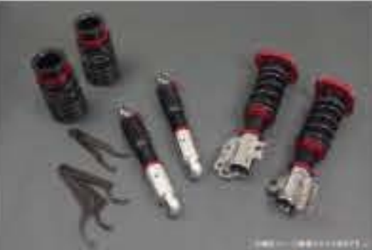
プロスペックライトレース車高調整キット スズキ Kei/Keiワークス HN11S/HN12S/HN21S/HN22S [PNS59-03] 120,000円 (税別)