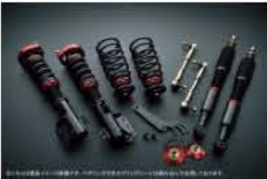
プロスベックステージ2 車高調整キット スズキ Kei HN11S/HN12S/HN21S [STPNS06A-4] 98,000円 (税別)