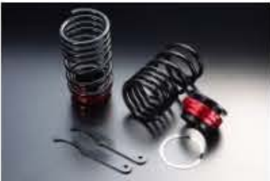
リア車高調キット スズキ ラパン HE21S [RKS3-2]