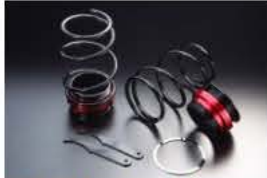
リア車高調キット ダイハツ ミラジーノ L650S [RKD3-7] 17,000円 (税別)