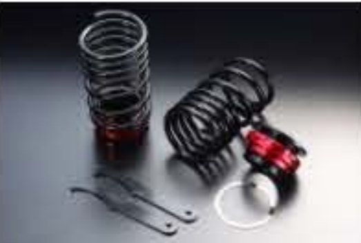
リア車高調キット スズキ Kei HN22S [RKS6-3] 17,000円 (税別)