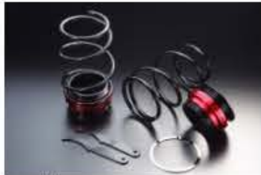
リア車高調キット ダイハツ ネイキッド L750S [RKD3-15] 17,000円 (税別)