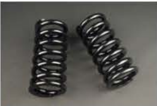
直巻スプリング 2本セット 62φ 200 mm 6K [SKP-SPT6220006-1] 7,000円 (税別)