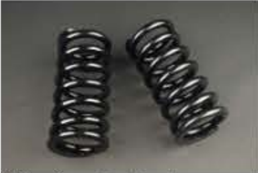
直巻スプリング 2本セット 62φ 220 mm 10K [SKP-SPT6222010-1] 7,000円 (税別)