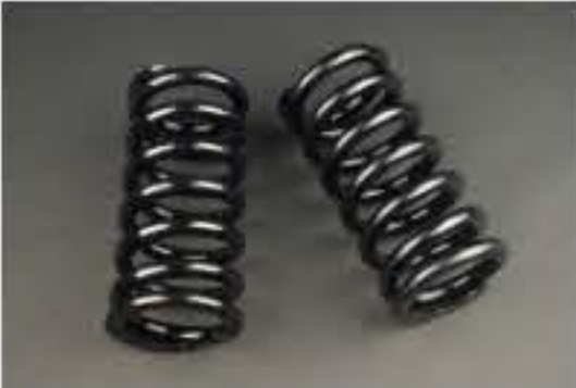
直巻スプリング 2本セット 62φ 220 mm 5K [SKP-SPT6222005-1] 7,000円 (税別)