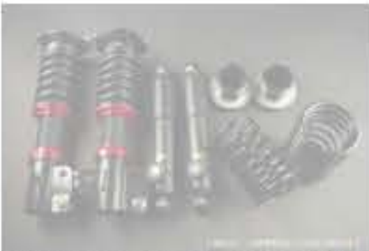
WinnersRun (ウィナーズラン) 車高調整キット スズキ アルト/アルトワークス CL11V/CM11V [SLSP60G-B20-6] 145,000円 (税別)