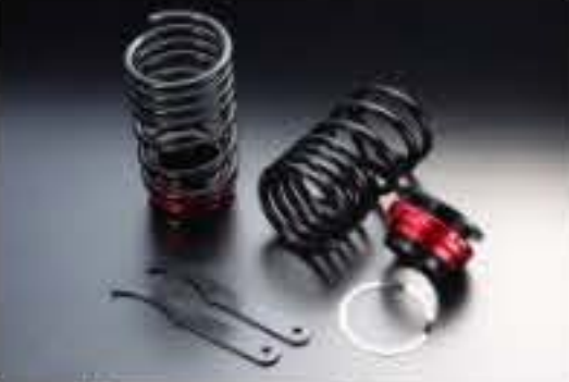
リア車高調キット スズキ アルト HA11S/HB11S/HA21S/HB21S [RKS6-10] 17,000円 (税別)