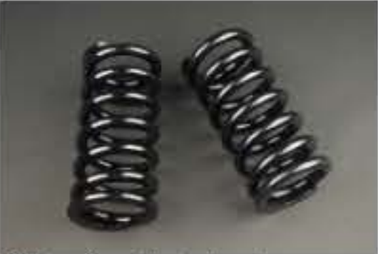
直巻スプリング 2本セット 62φ 220 mm 12K [SKP-SPT6222012-1] 9,800円 (税別)