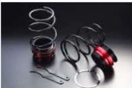
リア車高調キット ダイハツ ネイキッド L760S (4WD) [RKD3-16] 17,000円 (税別)