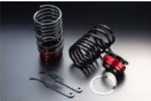
リア車高調キット スズキ アルト CN11S/CN21S/CR22S/CS22S/CL11V/CL21V/CL22V [RKS6-9] 17,000円 (税別)