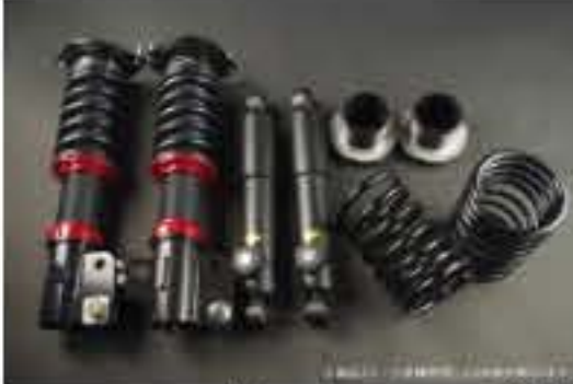
WinnersRun (ウィナーズラン) 車高調整キット スズキ アルト/アルトワークス HA12S/HA12V/HA22S [SLSP60K-B20-2] 145,000円 (税別)