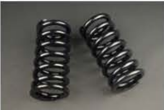
直巻スプリング 2本セット 62φ 200 mm 12K [SKP-SPT6220012-1] 7,000円 (税別)