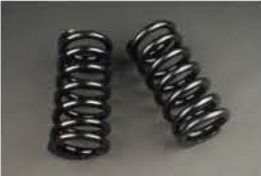
直巻スプリング 2本セット 62φ 200 mm 22K [SKP-SPT6220022-1] 9,800円 (税別)