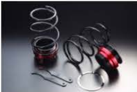
リア車高調キット ダイハツ エッセ L235S [RKD3-11] 17,000円 (税別)