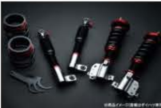
プロスペックライトレース車高調整キット ダイハツ コペン L880K [PND50-2] 120,000円 (税別)