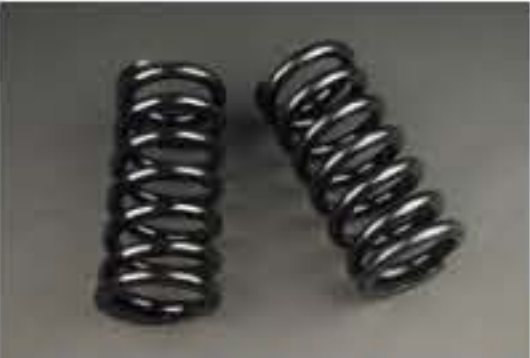
直巻スプリング 2本セット 62φ 200 mm 18K [SKP-SPT6220018-1] 9,800円 (税別)