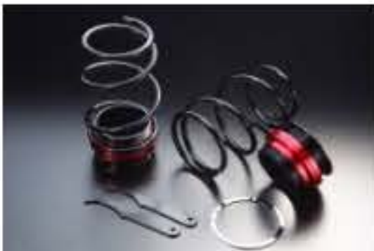
リア車高調キット トヨタ ビクシエボックス LA300A [RKD42-10] 17,000円 (税別)