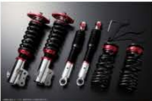
プロスベックワゴン 車高調整キット ダイハツ ミラココア L685S(4WD) スタビライザー未搭載車 [PND25B-4] 98,000円 (税別)