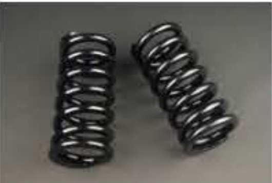
直巻スプリング 2本セット 62φ 220 mm 7K [SKP-SPT6220007-1] 7,000円 (税別)