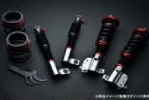
プロスペックライトレース車高調整キット ダイハツ ムーヴ L900S/L902S [PND50-4] 120,000円 (税別)