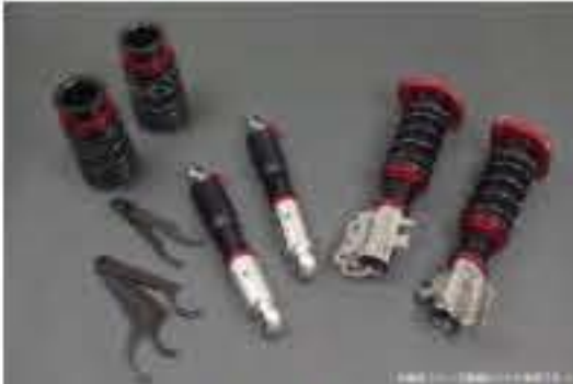
プロスペックライトレース車高調整キット スズキ ワゴンR MC11S/MC12S/MC21S/MC22S (1型~4型 ~ H14.08) [PNS59-02] 120,000円 (税別)