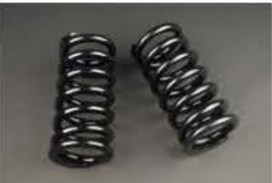
直巻スプリング 2本セット 62φ 200 mm 8K [SKP-SPT6220008-1] 7,000円 (税別)