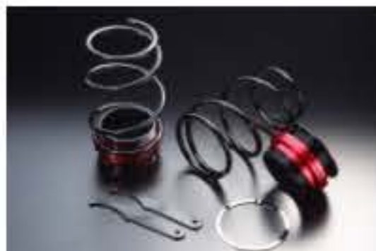
リア車高調キット ダイハツ MAX L960S/L962S (4WD) [RKD3-18] 17,000円 (税別)