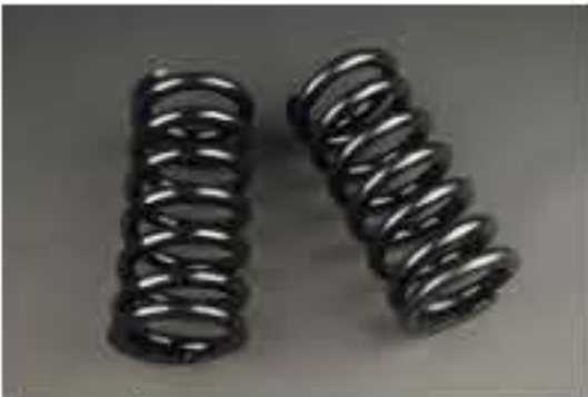
直巻スプリング 2本セット 62φ 200 mm 10K [SKP-SPT6220010-1] 7,000円 (税別)