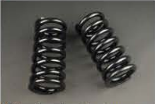
直巻スプリング 2本セット 62φ 220 mm 6K [SKP-SPT6222006-1] 7,000円 (税別)