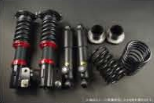
WinnersRun (ウィナーズラン) 車高調整キット スズキ セルボモード CN22S/CP22S [SLSP60G-B20-9] 145,000円 (税別)