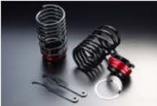
リア車高調キット スズキ ワゴンR MC12S/MC22S (1~4型まで) [RKS6-5] 17,000円 (税別)