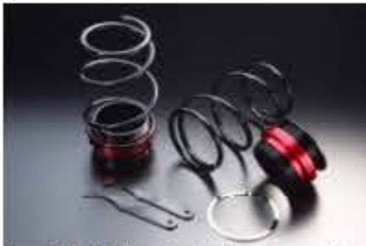
リア車高調キット ダイハツ ムーヴ L150S/L152S [RKD3-3] 17,000円 (税別)