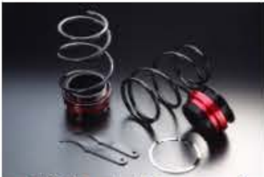
リア車高調キット ダイハツ ムーヴ L910S/L912S [RKD3-2] 17,000円 (税別)