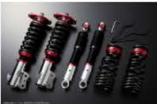
プロスベックワゴン 車高調整キット ダイハツ ムーヴコンテ L585S(4WD) スタビライザー搭載車 [PND25A-3] 98,000円 (税別)