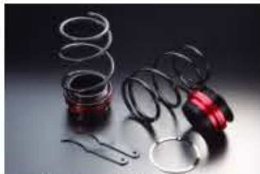
リア車高調キット ダイハツ ミラ L275S [RKD42-1] 17,000円 (税別)