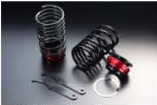
リア車高調キット スズキ ワゴンR M H21S (1型/2型) [RKS3-3]