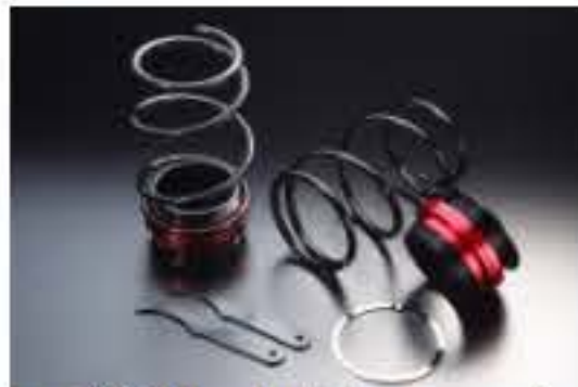
リア車高調キット ダイハツ ムーヴ L175S [RKD42-2] 17,000円 (税別)