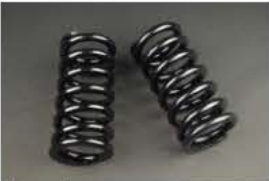
直巻スプリング 2本セット 62φ 200 mm 9K [SKP-SPT6220009-1] 7,000円 (税別)