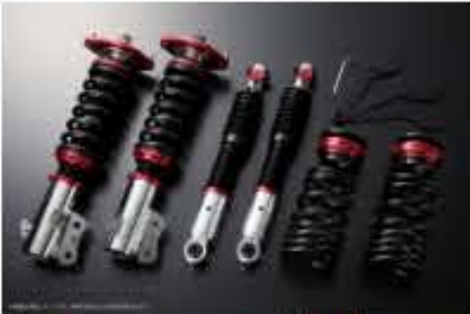
プロスベックワゴン 車高調整キット ダイハツ タント LA610S(4WD) スタビライザー未搭載車 [PND25B-11] 98,000円 (税別)