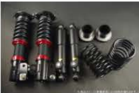
WinnersRun (ウィナーズラン) 車高調整キット スズキ アルト/アルトワークス CM22V [SLSP60G-B20-3] 145,000円 (税別)