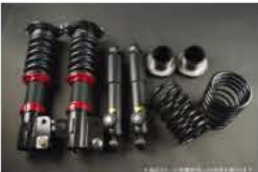
WinnersRun (ウィナーズラン) 車高調整キット スズキ アルト/アルトワークス HA11S/HA21S [SLSP60G-B20-1] 145,000円 (税別)