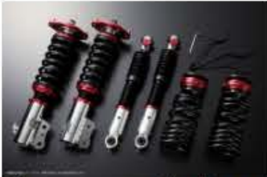
プロスベックワゴン 車高調整キット スバル ルクラ L465F(4WD) スタビライザー搭載車 [PND25A-8] 98,000円 (税別)