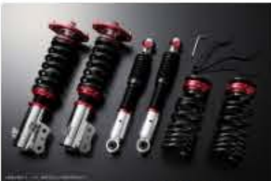
プロスベックワゴン 車高調整キット スバル プレオ L285F(4WD) スタビライザー搭載車 [PND25A-7] 98,000円 (税別)