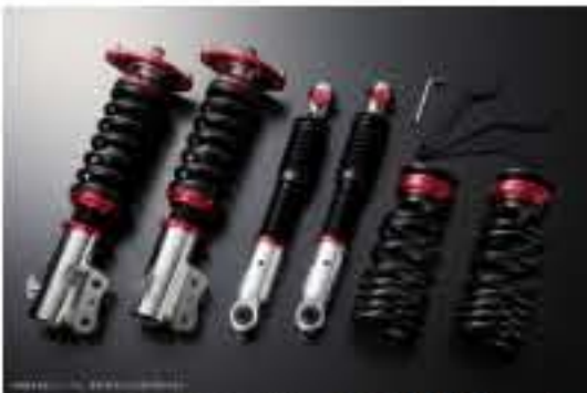
プロスベックワゴン 車高調整キット ダイハツ タントエグゼ L465S(4WD) スタビライザー搭載車 [PND25A-6] 98,000円 (税別)