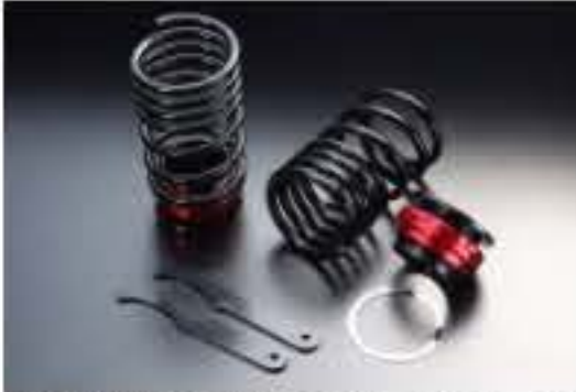
リア車高調キット スズキ アルト HA12S/HA22S/HA23S [RKS6-1] 17,000円 (税別)