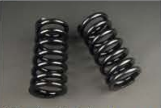
直巻スプリング 2本セット 62φ 250 mm 11K [SKP-SPT6225011-1] 9,800円 (税別)