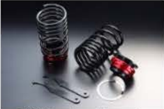
リア車高調キット スズキ アルト HA25S/HA25V/HA35S [RKS52-3]