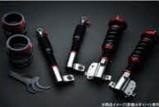
プロスペックライトレース車高調整キット ダイハツ ネイキッド L750S [PND50-6] 120,000円 (税別)