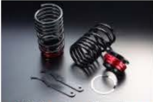
リア車高調キット スズキ ワゴンR M H34S [RKS52-5]