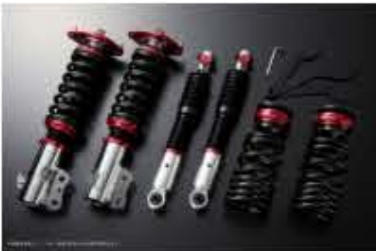
プロスベックワゴン 車高調整キット ダイハツ タント LA610S(4WD) スタビライザー搭載車 [PND25A-10] 98,000円 (税別)