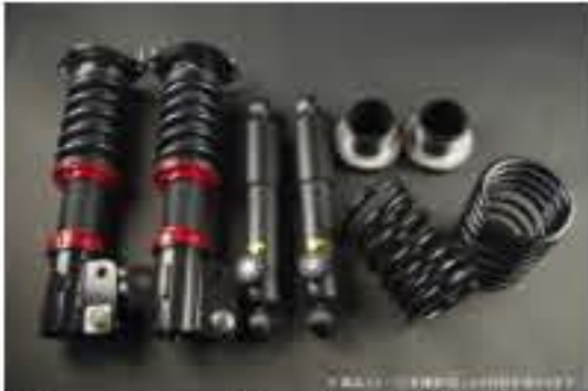
WinnersRun (ウィナーズラン) 車高調整キット スズキ アルト/アルトワークス HA23S/HA23V [SLSP60K-B20-1] 145,000円 (税別)