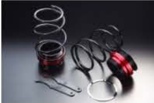
リア車高調キット ダイハツ ミラジーノ L710S (4WD) [RKD3-6] 17,000円 (税別)