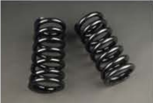
直巻スプリング 2本セット 62φ 220 mm 11K [SKP-SPT6222011-1] 9,800円 (税別)