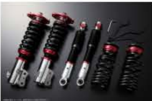
プロスベックワゴン 車高調整キット ダイハツ ミラココア L685S(4WD) スタビライザー搭載車 [PND25A-4] 98,000円 (税別)