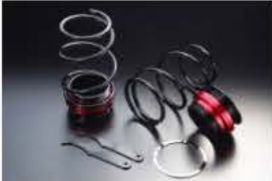
リア車高調キット ダイハツ ミラジーノ L700S [RKD3-5] 17,000円 (税別)