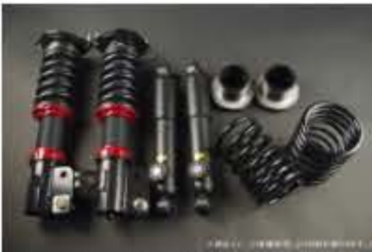
WinnersRun (ウィナーズラン) 車高調整キット スズキ アルト/アルトワークス CN21S/CP21S [SLSP60G-B20-5] 145,000円 (税別)