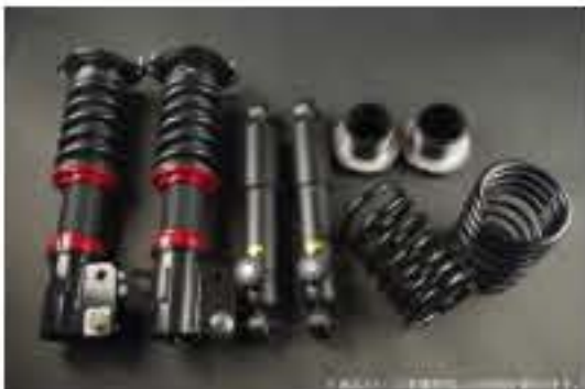
WinnersRun (ウィナーズラン) 車高調整キット スズキ セルボモード CN 32S/CP32S [SLSP60G-B20-7] 145,000円 (税別)