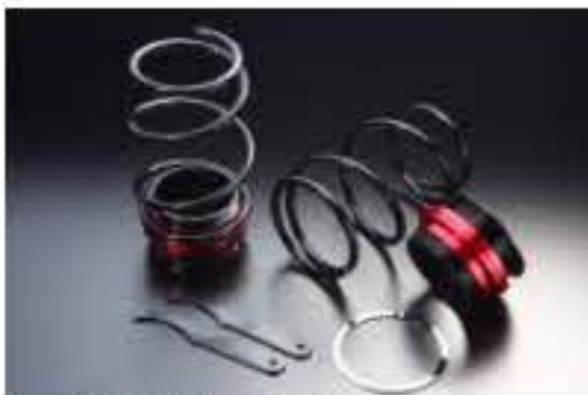
リア車高調キット ダイハツ コペン L880K [RKD3-9] 17,000円 (税別)