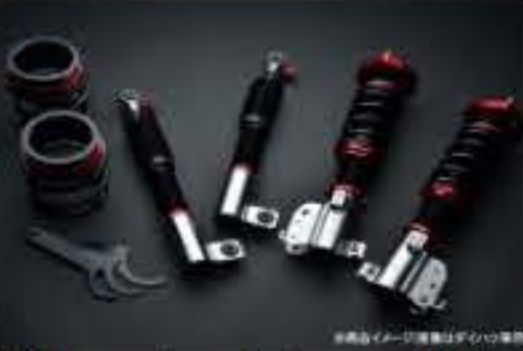
プロスペックライトレース車高調整キット ダイハツ オプティ L800S/L802S [PND50-3] 120,000円 (税別)