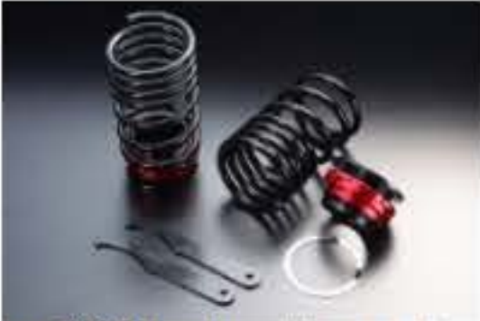
リア車高調キット スズキ MRワゴン MF33S [RKS52-7]