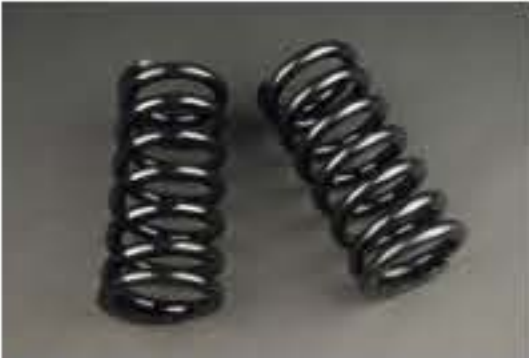
直巻スプリング 2本セット 62φ 220 mm 9K [SKP-SPT6222009-1] 9,800円 (税別)