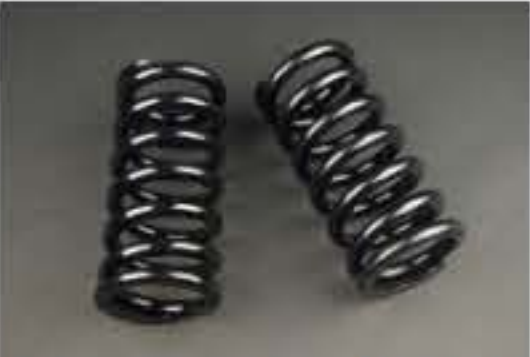
直巻スプリング 2本セット 62φ 220 mm 14K [SKP-SPT6222014-1] 9,800円 (税別)