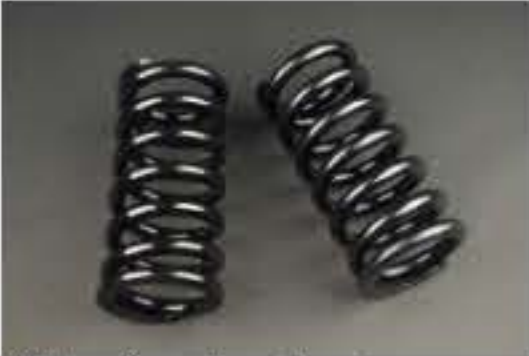
直巻スプリング 2本セット 62φ 220 mm 4K [SKP-SPT6222004-1] 7,000円 (税別)