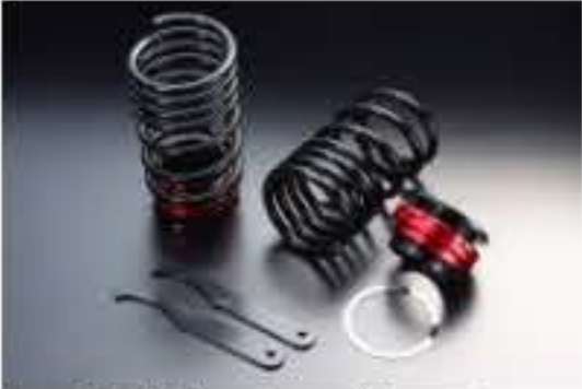
リア車高調キット スズキ ワゴンR M H23S [RKS52-1]