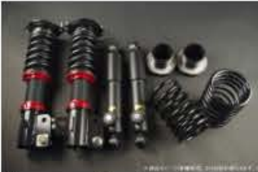
WinnersRun (ウィナーズラン) 車高調整キット スズキ アルト/アルトワークス HB11S/HB21S [SLSP60G-B20-2] 145,000円 (税別)