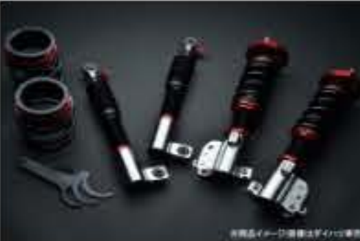
プロスペックライトレース車高調整キット ダイハツ ミラ L700S/L700V [PND50-1] 120,000円 (税別)