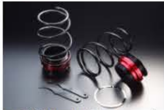
リア車高調キット ダイハツ ムーヴ L550S [RKD3-4] 17,000円 (税別)