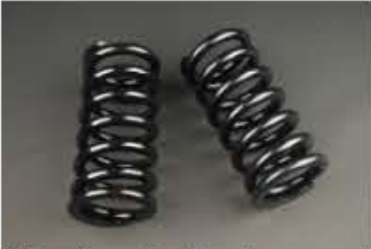
直巻スプリング 2本セット 62φ 230 mm 12K [SKP-SPT6223012-1] 9,800円 (税別)