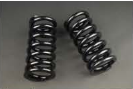
直巻スプリング 2本セット 62φ 200 mm 11K [SKP-SPT6220011-1] 7,000円 (税別)