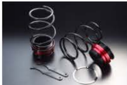
リア車高調キット ダイハツ タント LA600S [RKD42-12] 17,000円 (税別)