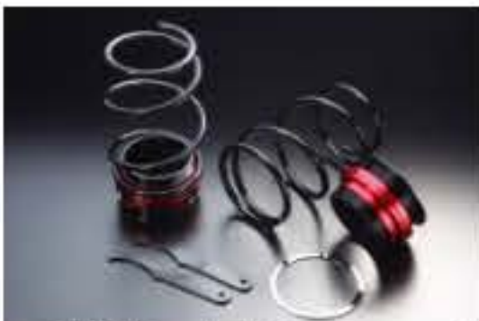
リア車高調キット ダイハツ ミラアヴィ L250S [RKD3-8] 17,000円 (税別)