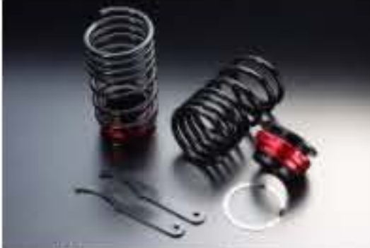
リア車高調キット スズキ ワゴンR MC11S/MC21S (4WD) [RKS6-6] 17,000円 (税別)