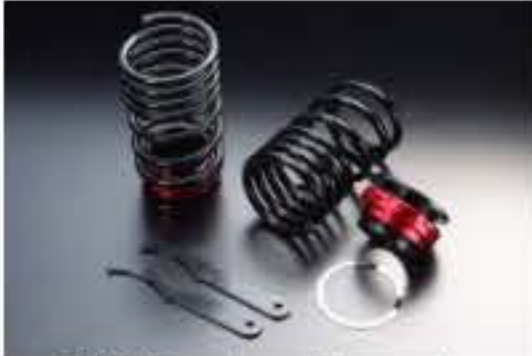
リア車高調キット スズキ アルト HA24S/HA24V [RKS3-9]