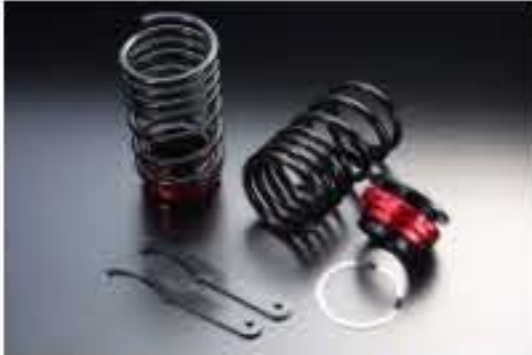
リア車高調キット スズキ MRワゴン MF21S [RKS3-6]