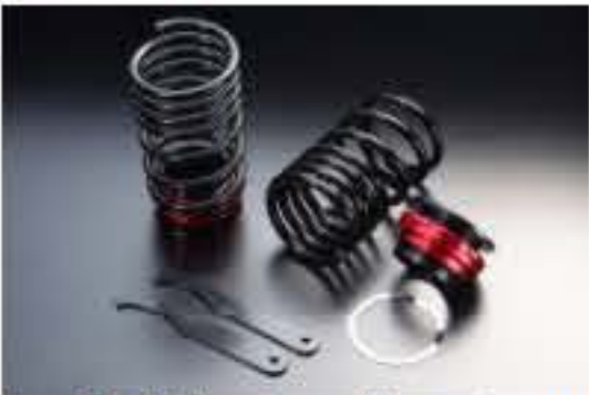
リア車高調キット スズキ ワゴンR M H21S (4WD) (3型以降) [RKS3-4]