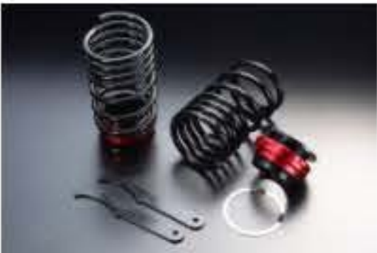
リア車高調キット ニッサン モコ MG21S/MG22S [RKS3-10]